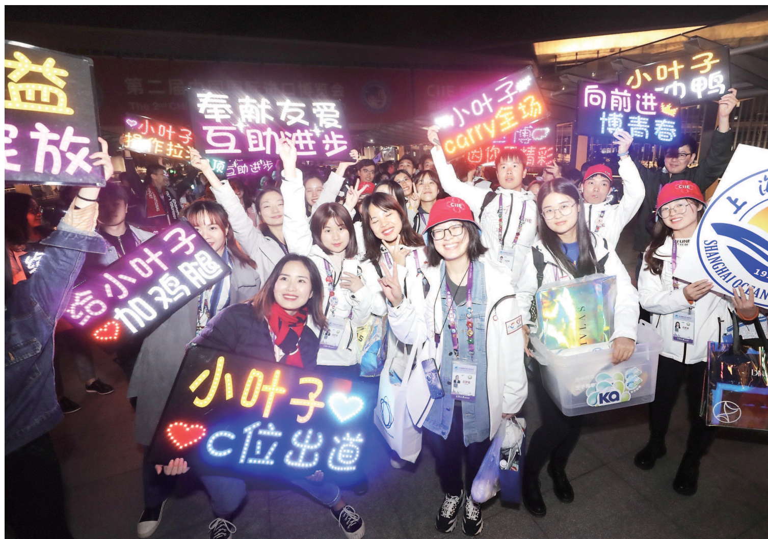
一批批结束最后工作的“小叶子”们伴随着欢呼声和歌声离开。左图：在国家会展中心（上海）东登录大厅的天桥上举行的一场特殊的欢送仪式。