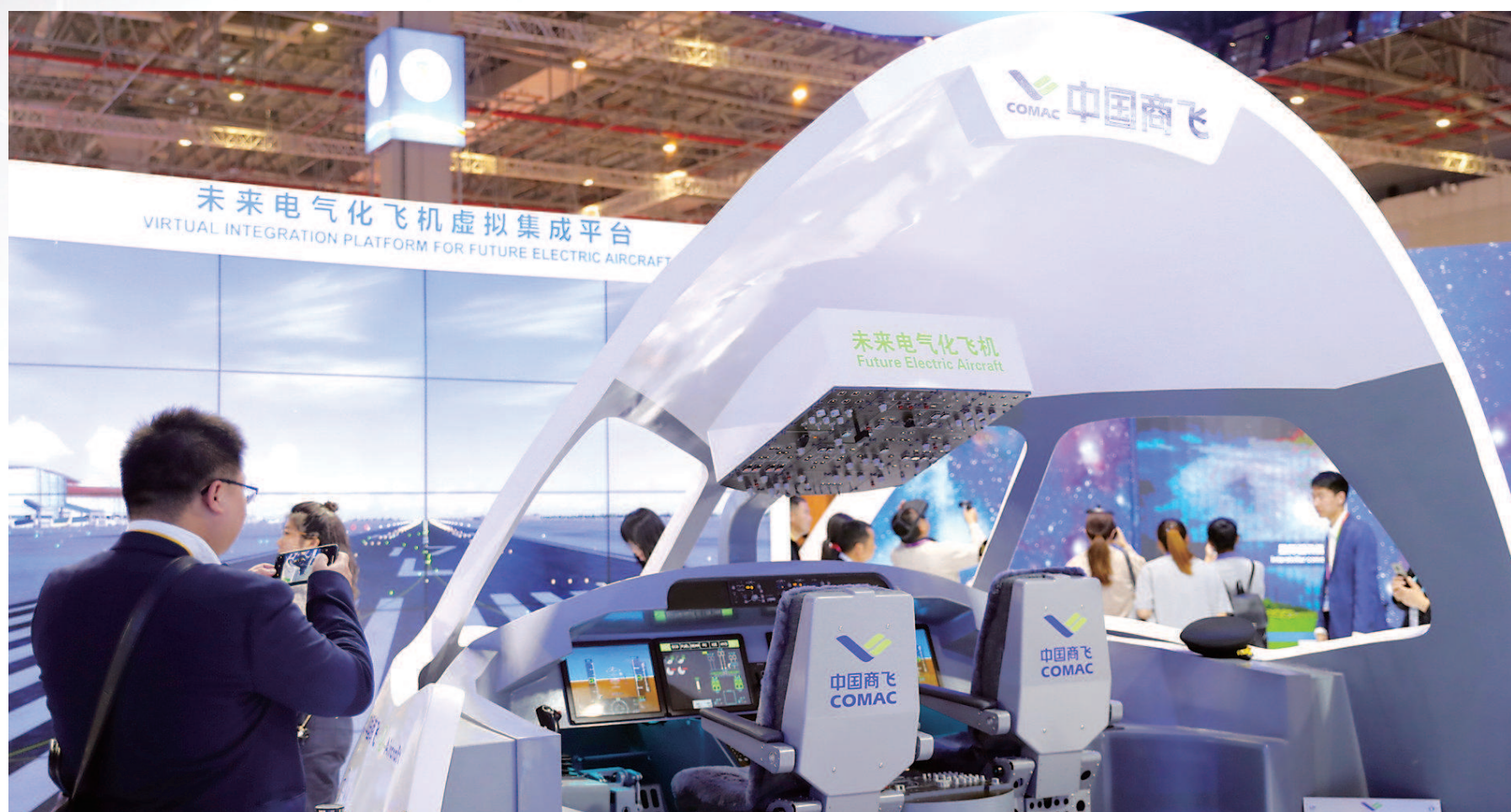
中国国家馆内展出的商飞体验馆,体现出中国大飞机制造方面取得的巨大进步。