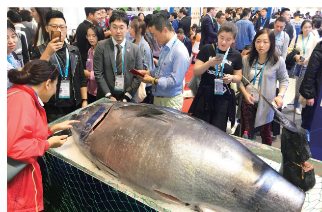
这条蓝鳍金枪鱼吸引大批观众围观。本报记者 赵立荣摄

昨天的这场开鱼大秀,同时也是联通参展商与采购商的纽带。现场,光明食品集团“The AmartChain”全球食品集成分销平台宣布落地,而阿尔博公司就是光明集团带来的参展商,为其生鲜产品入华按下了“快捷键”。据悉,这个分销平台的落地,将进一步汇聚全球优质食品资源,打通国内外渠道,通过海外供应、香港集成的国内对接和分销一站式解决方案,为全球买家、卖家简化流程,提供高效服务。