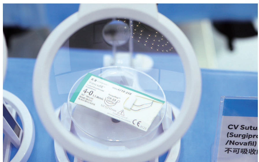
美敦力展示不可吸收缝合线。