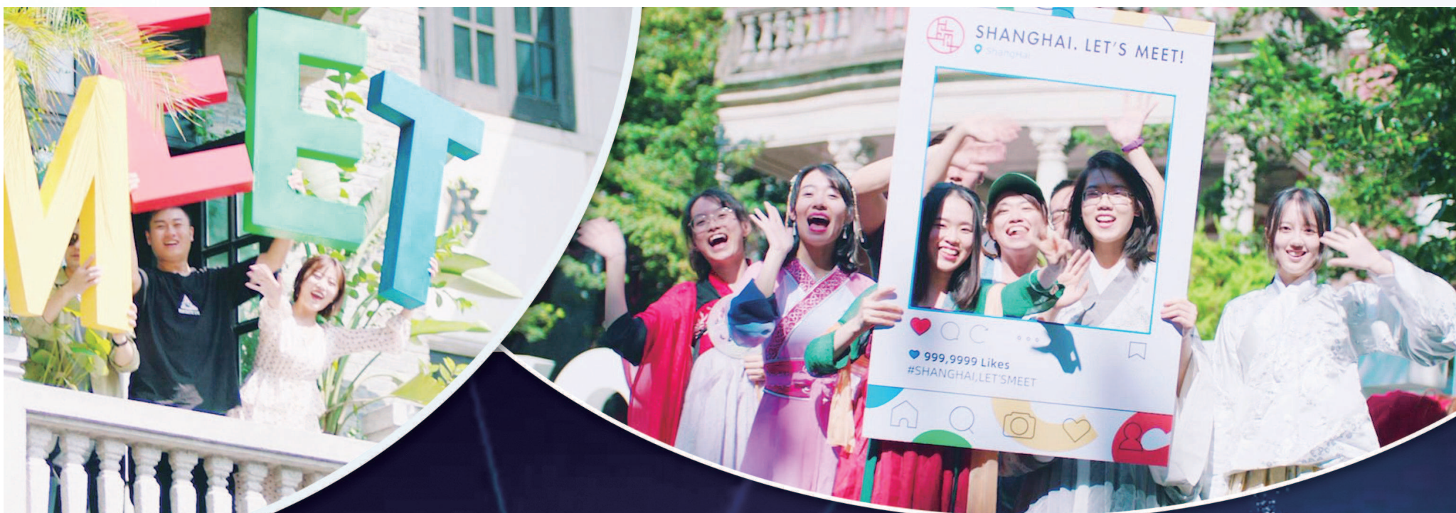
进博会城市形象片《上海·恒新之城》截图。

事实上，如武康大楼修缮、垃圾分类等情境，根据初始策划，通过实地考察勘景，逐格细化脚本，最终顺利实现拍摄计划的案例并不多，更常规的工作