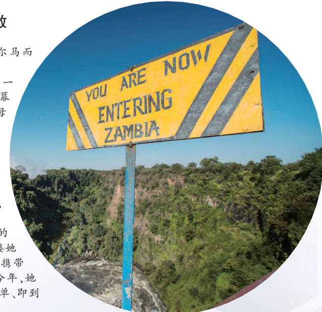
本版供稿：赵征南