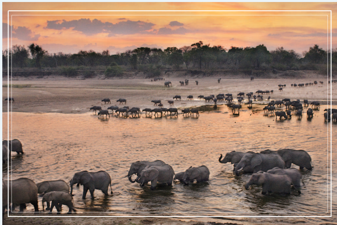
赞比亚位于非洲大陆东南部，土地肥沃，水利资源充沛，旅游资源丰富。

如今，中国国际进口博览会有望为非洲国家提供一条崭新的“发展之路”。今年，赞比亚受邀作为非洲地区唯一主宾国首次参加进博会国家展，率团来沪的赞比亚商业、贸易与工业部长克里斯托弗·亚卢马表示，这对赞比亚来说是一份荣耀，更是赞比亚商品一次难得的展示机会，“进博会为非洲国家打开了另一条经济发展之路”。