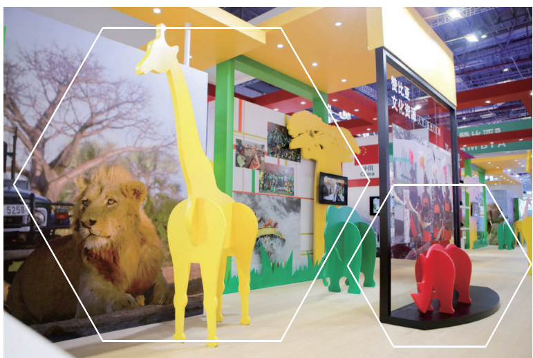
本届进博会赞比亚馆。