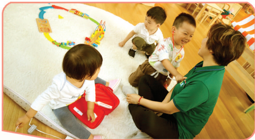
黄浦五里桥社区托育园内，小朋友在做游戏。