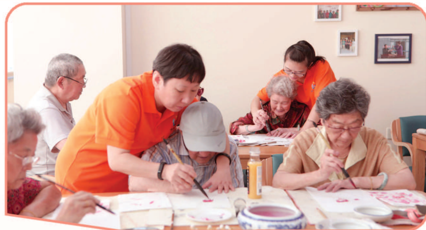
在虹口区市民驿站嘉兴路街道第一分站，社区居家养老服务、社区食堂深受居民好评。图为志愿者带领老人体验传统书画。