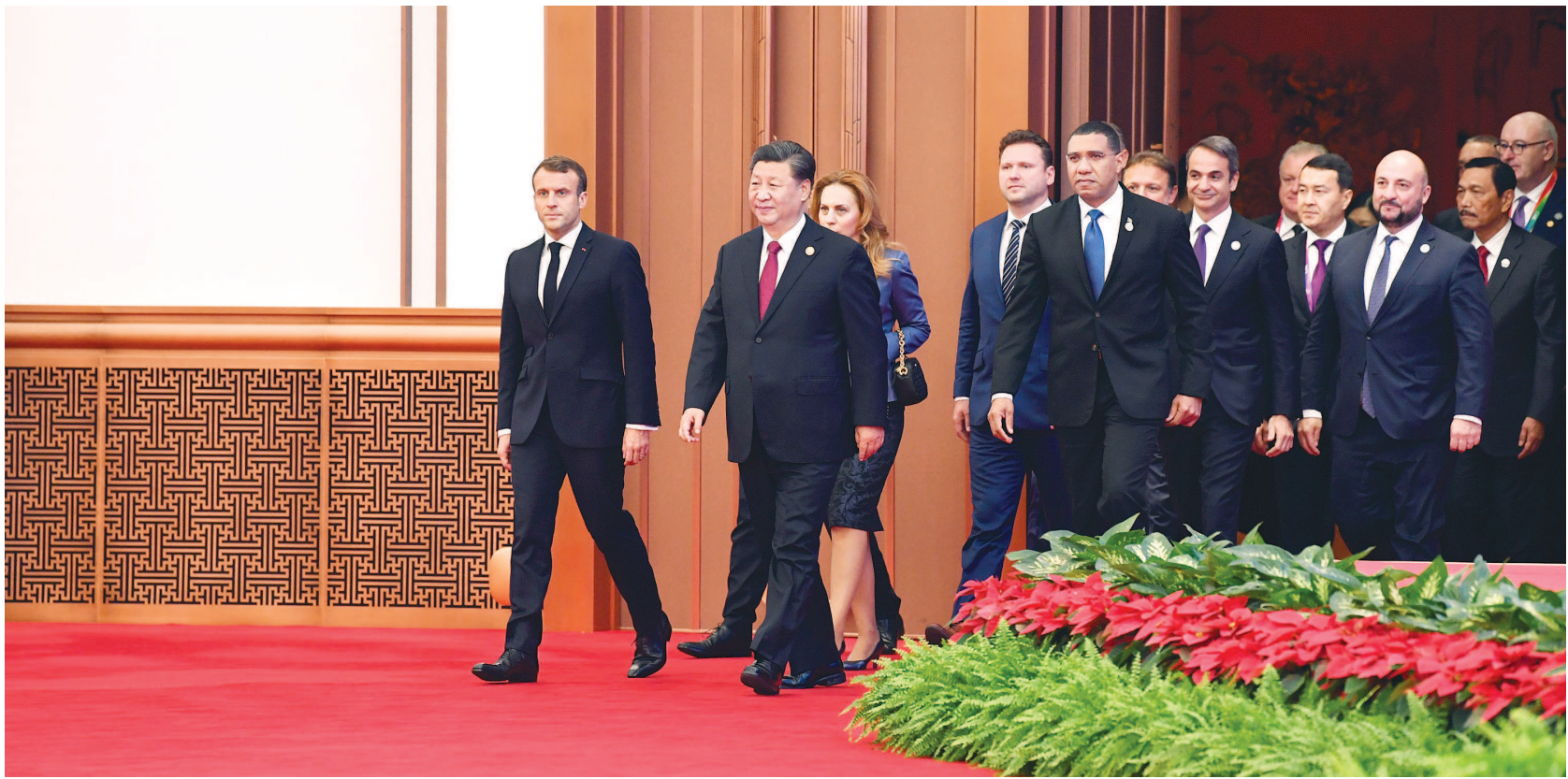
国家主席习近平出席开幕式并发表题为《开放合作 命运与共》的主旨演讲。这是习近平同外方领导人一同步入会场。