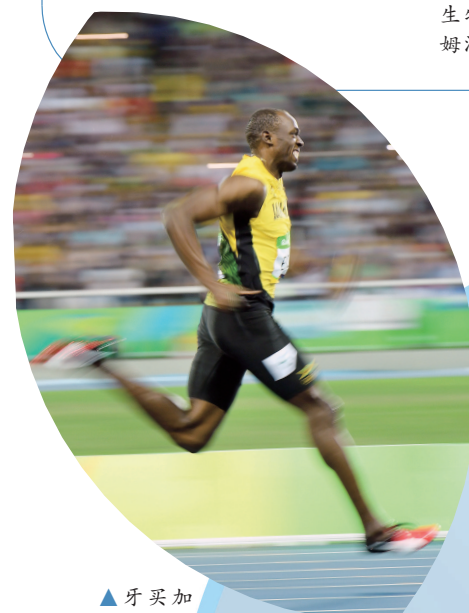
▲牙买加“飞人”博尔特