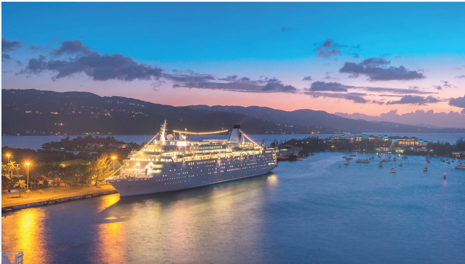
牙买加丰富的的美食和优美的环境，给中国消费者留下了深刻印象。

对牙买加来说，以主宾国身份参加第二届进博会，必将进一步激发对华出口，有助于实现牙买加“宜居、宜工、宜家、宜商”的发展目标。