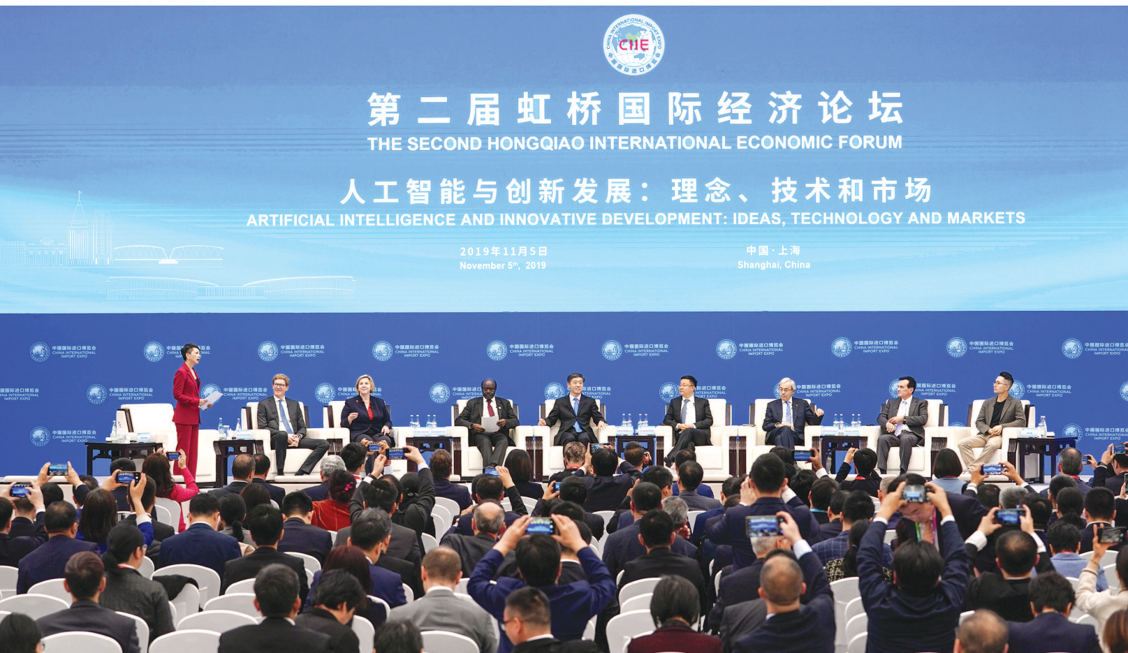
在昨天举行的虹桥国际经济论坛“人工智能与创新发展”分论坛，国际政产学研界嘉宾通过演讲和圆桌互动，就“人工智能的‘善治之道’”深入求解。