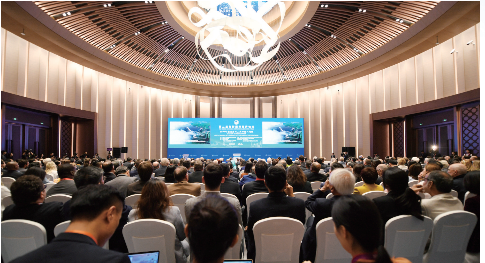
昨天，第二届虹桥国际经济论坛“70年中国发展与人类命运共同体”分论坛在上海举行。

■坚持合作共赢，促进世界各国发展经验化作远见卓识；坚持与时俱进，打造全球发展新动能，推进开放包容、普惠共赢的新型经济全球化；坚持求同存异，做人类共同发展的促进者，在认同、参与、推动人类命运共同体的构建过程中，凝聚强大精神动力