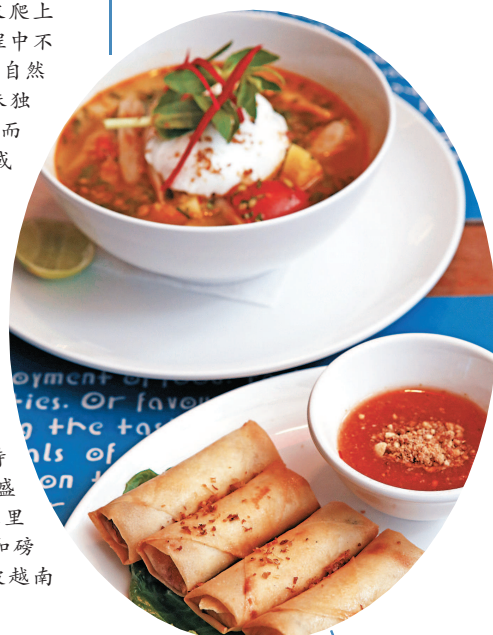
▲柬埔寨传统美食素春卷与莲藕酸辣汤。

柬埔寨特产中，还有世界“四大干果仁”成员之一的腰果，营养价值极高，深受消费者喜爱。这也是游客必选的柬埔寨特产，并被大量出口到国际市场。在柬埔寨，盛产腰果的省份主要有磅湛省、腊塔纳基里省、蒙多基里省、上丁省、桔井省、贡布省和磅士卑省等。每年产出的腰果大部分都会被越南人买走，在经过加工之后，销往中国市场。