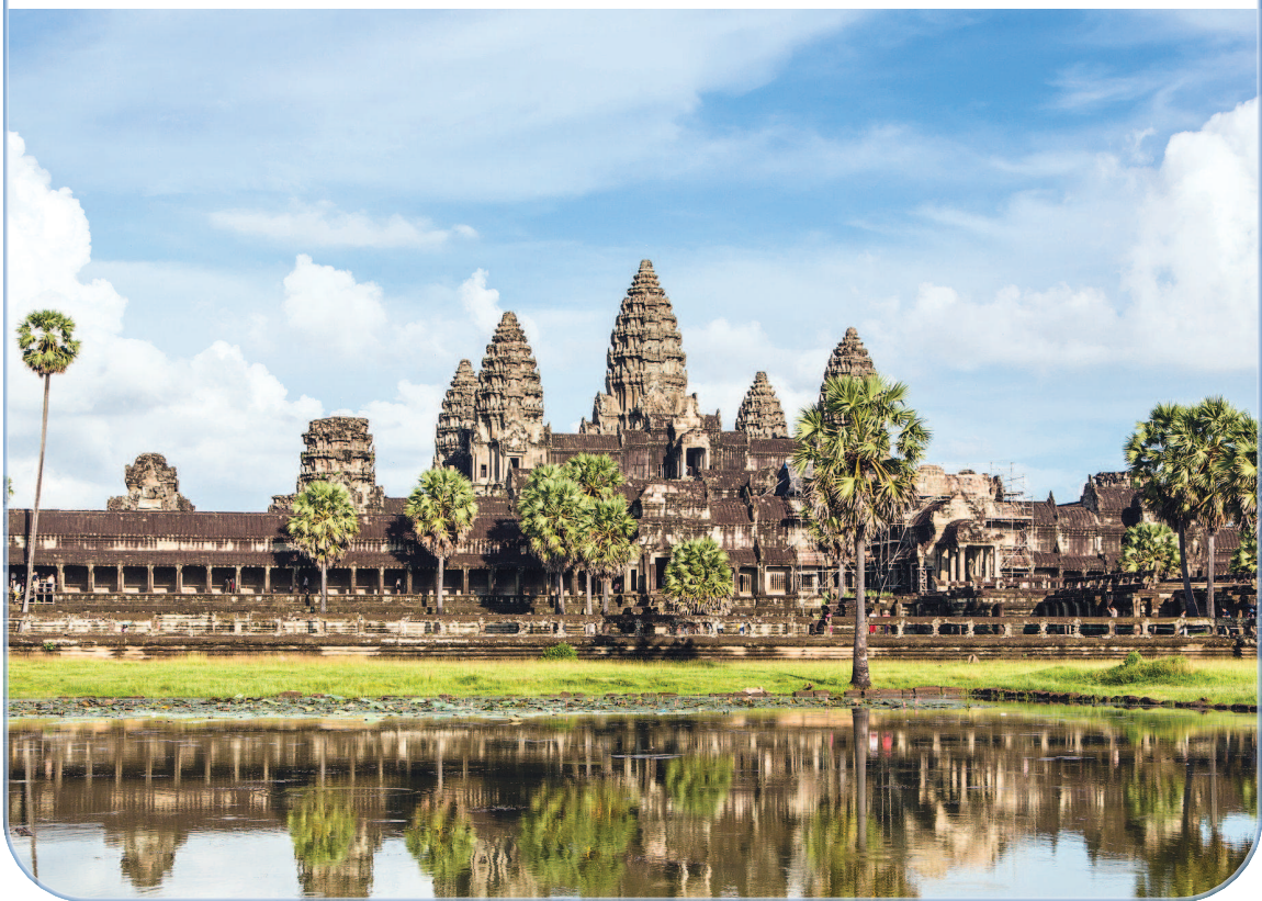
▲柬埔寨是东南亚历史悠久的文明古国。图为吴哥窟。

作为“一带一路”沿线重要国家之一，柬埔寨近年经济社会发展成就有目共睹。自去年参展首届中国国际进口博览会后，柬埔寨与中国的经贸关系加速发展，对华出口额快速增长。