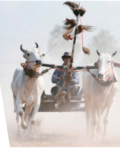
▲柬埔寨村民举行牛车赛跑。

柬埔寨国土面积 181035 平方公里，在东南亚 11 个国家中居第 8 位，大致与我国湖北省面积相当。