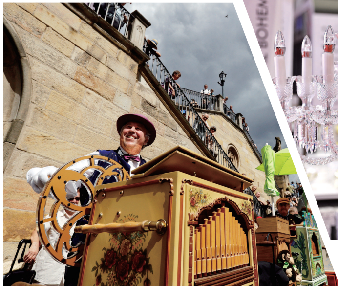
▲捷克水晶制品。本报记者 袁婧摄 ▲乐手正在演奏手摇风琴。新华社发

要说中国消费者最熟悉的捷克品牌，恐怕非斯柯达汽车莫属。作为全球历史最悠久的汽车品牌之一，创立于1895年的斯柯达，早在1935年就第一次将汽车出口到中国。2007年，斯柯达开始与上汽大众合作，进军中国市场；经过短短三年，2010年中国就成为斯柯达品牌最大的单一市场。2018年，斯柯达在中国售出了超过34.1万辆汽车。