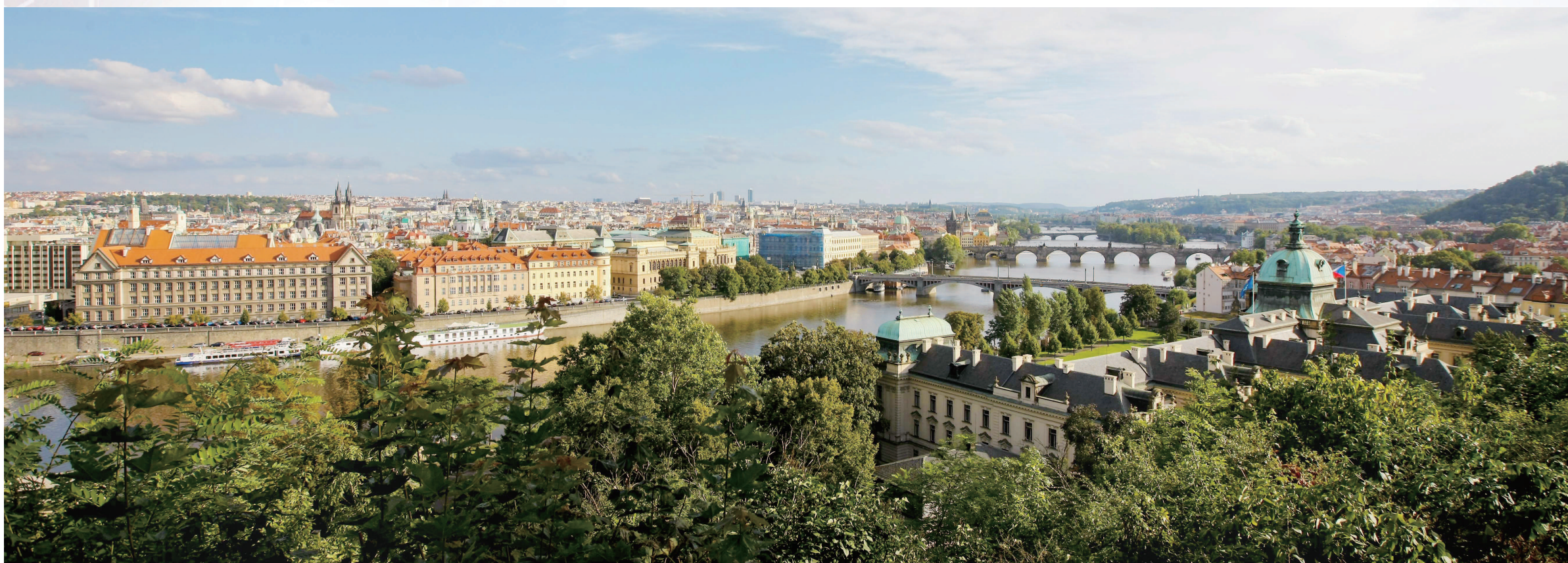
▲阳光下的布拉格老城区与伏尔塔瓦河。

捷克，欧洲中部一个既年轻又古老的国度。说它年轻，是因为捷克于1993年1月1日起成为独立的主权国家，至今不过26年。说她古老，则因早在公元895年，一部分西斯拉夫人就建立了捷克公国并延续了725年。