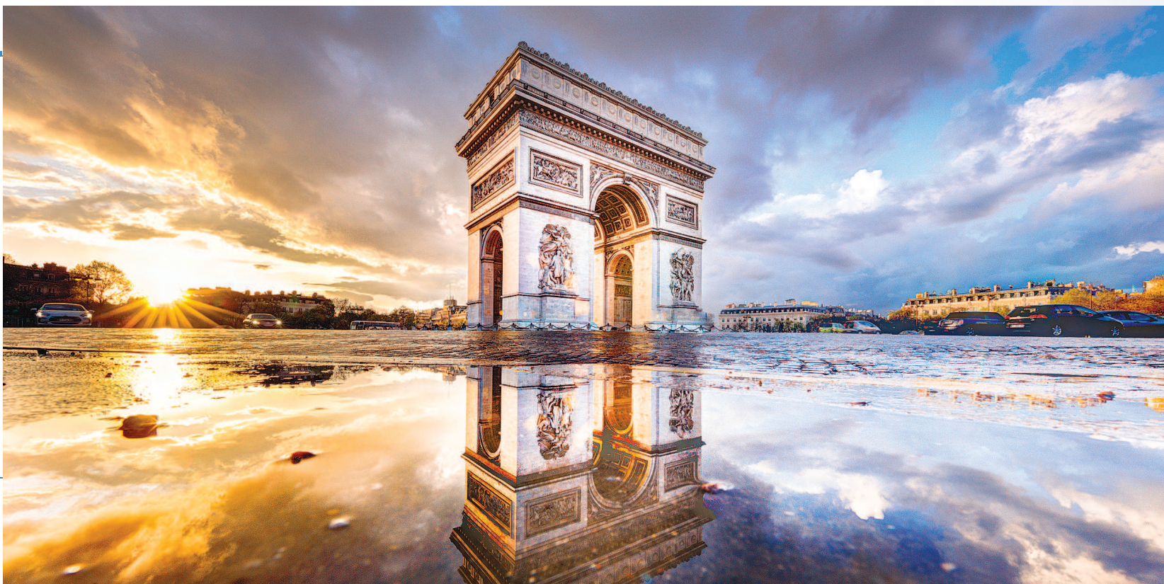
右图：法国高端服务业将成为未来中法两国经贸合作的新领域。图为凯旋门。

本届进博会法国国家馆的主题为“法在其中：法国企业服务中国消费者”。参展企业代表称，进博会已成为法国了解中国、推进中法合作的重要窗口，希望借助进博会这一国际化经贸平台拓展庞大的中国市场，分享中国消费市场的红利。