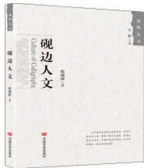
《砚边人文》 张瑞田著 言实出版社 (2019年8月版)

现在的书法失去了原有的实用功能,只能以传统文化的遗韵观照人们的审美意识。其实人们更为追求的是像古人那样的日常书写,不是表演性质的。因此,作者认为还是要回归质的东西,书法并非技法之道,而是要重人格与学养。