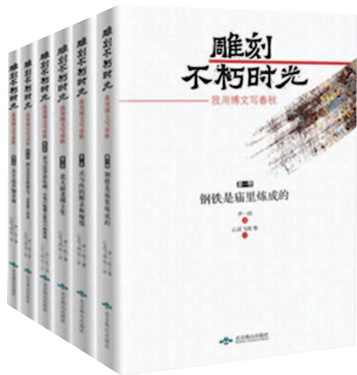
《雕刻不朽时光》 齐一民著 心灵飞鸿等评 北京燕山出版社 (2019年5月版)

《雕刻不朽时光》共六卷本,140余万字,创作时间跨越六个年头,串联起21世纪初期复杂变化的生活面相。