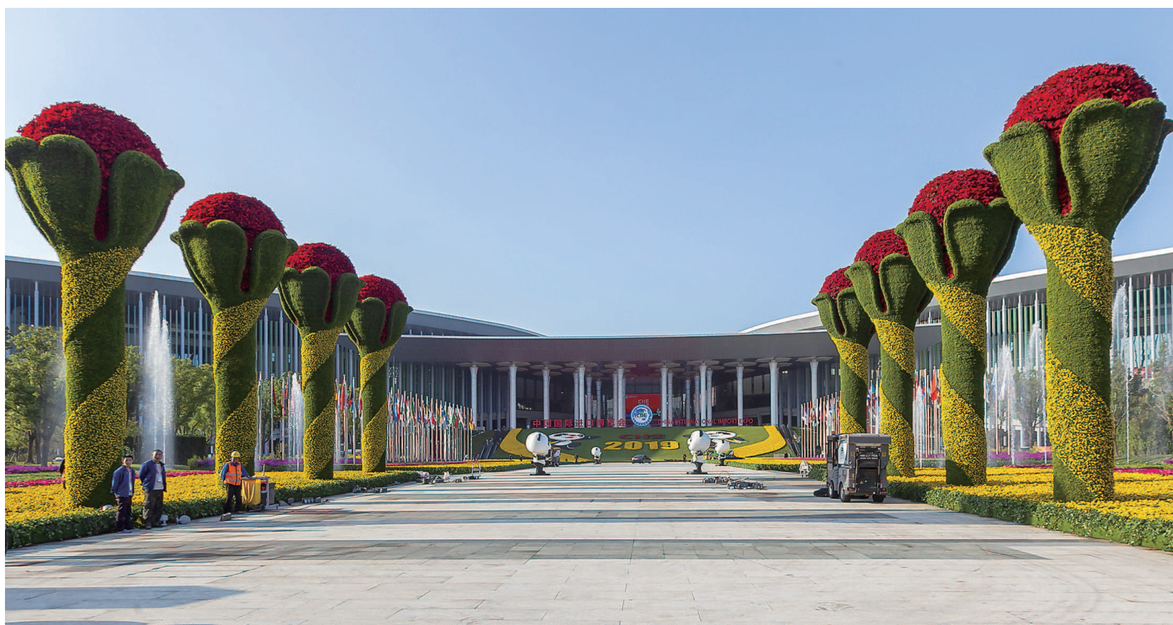
11月3日拍摄的国家会展中心(上海)南广场的鲜花景观,入口八个高度9米的花柱象征“四叶草”绽放。