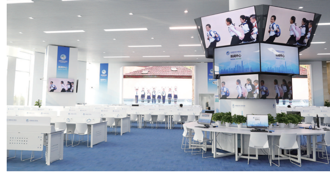
▲ 新闻中心已布置完毕迎接中外媒体的到来。