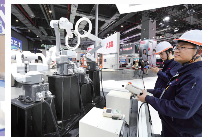
▼ 青浦公安正在进博会场馆进行安检。 本报记者 赵立荣摄

▲ 品质生活展区的展商在探讨布展细节。 本报记者 袁婧摄 ▲ 医疗器械及医药保健展区的参展商安装康复器械。 本报记者 叶辰亮摄 ▼ 技术人员调试智能制造机械手臂。 本报记者 赵立荣摄