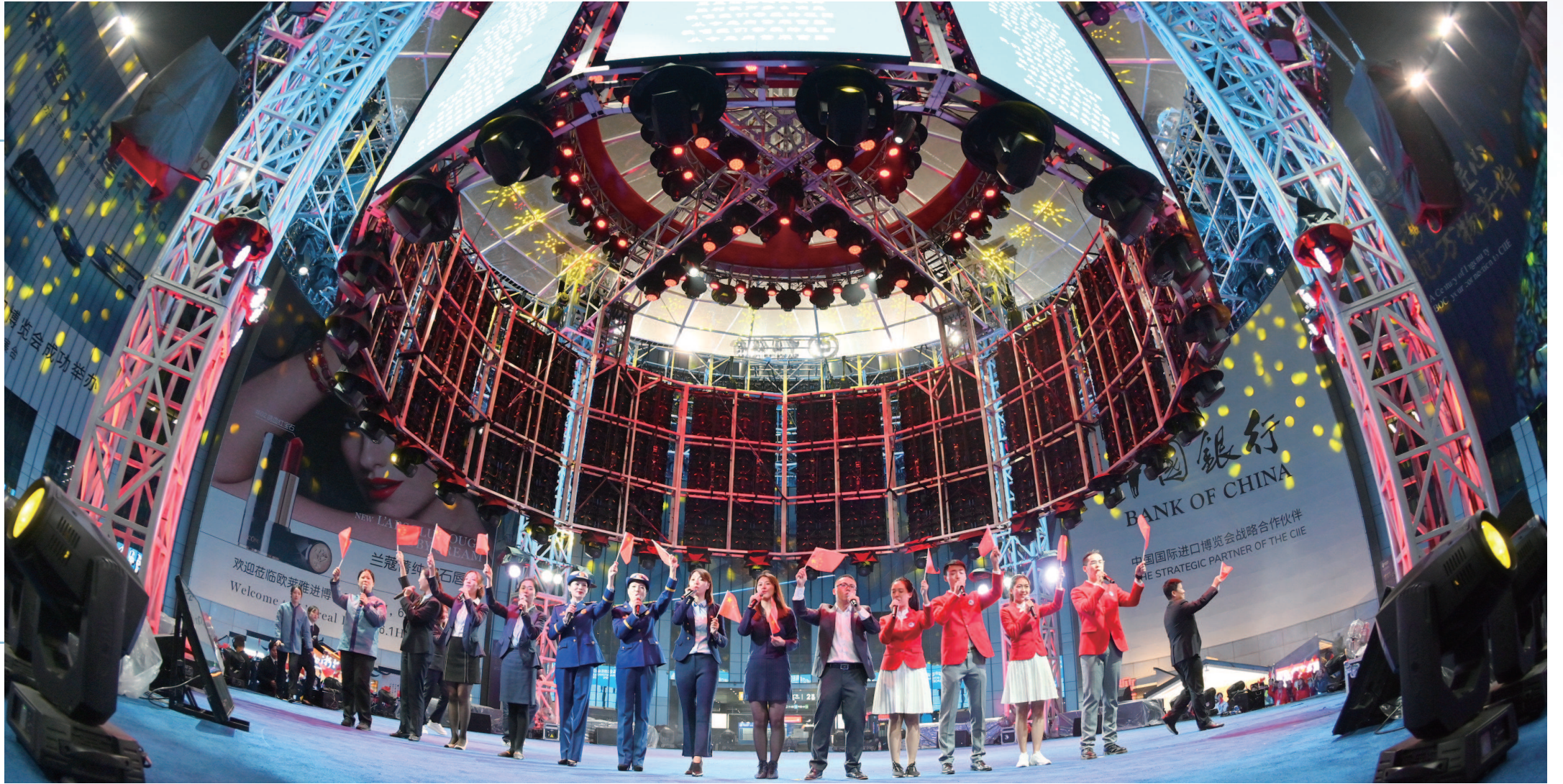
第二届进博会誓师主题活动昨举行,保障团队以昂扬的精神面貌迎接第二届进博会盛大开幕。

五年来,“微笑四叶草”志愿者团队累计服务30个大型展览,11927人次志愿者参与,服务时长达122572小时;先后获评“青浦区志愿者优秀项目”“上海市志愿服务先进集体”“上海市优秀志愿服务品牌项目”,2018年入选全国志愿服务先进“四个100”最佳志愿服务项目,已成为响当当的志愿服务品牌。