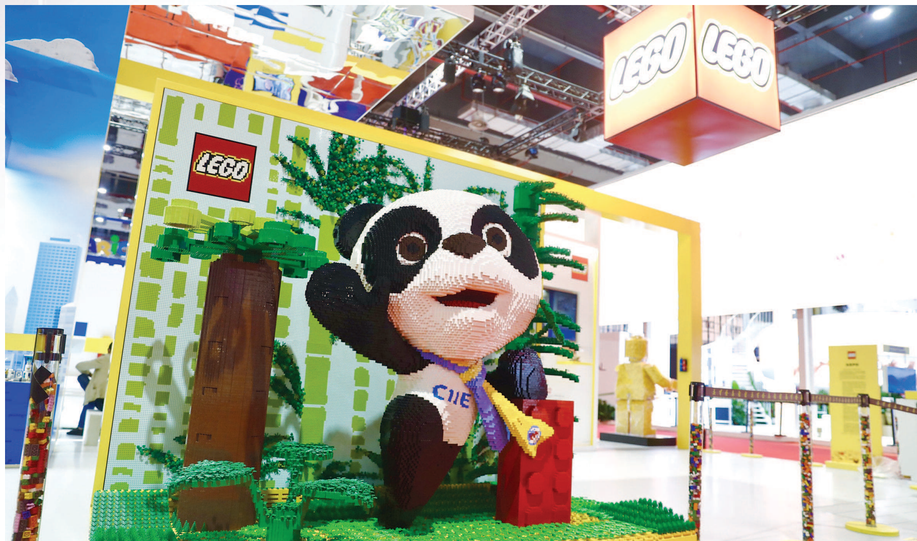
乐高展台前，一个由21.1万块积木拼砌的3D“进宝”憨态可掬地迎送来往宾客。