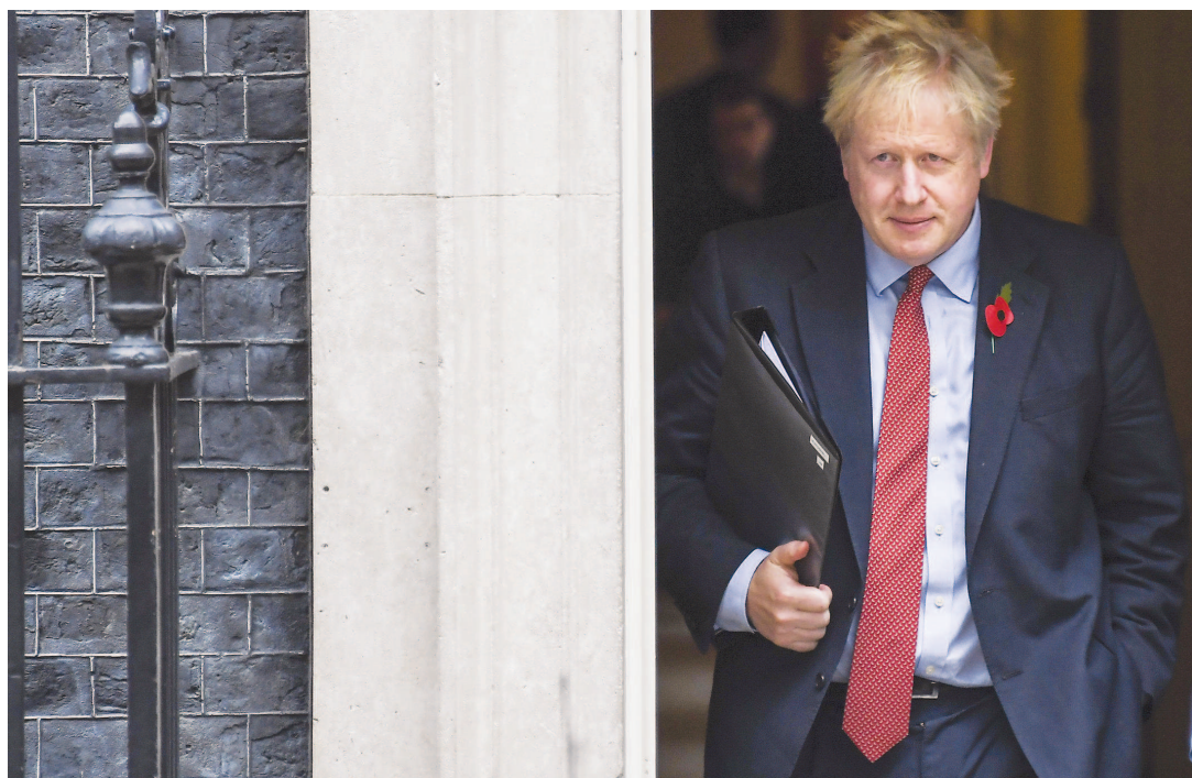
10月29日，在英国伦敦，英国首相约翰逊离开唐宁街10号首相府前往议会。新华社发

变幻的局势使约翰逊政府不得不转变策略：与其和议会打一场通过WAB，继而通过“脱欧”新协议的“持久战”，不如解散议会，重新洗牌。10月28日，约翰逊两个月来第三次提出提前大选动议，由于难以取得“定期议会法”规定的2/3(434票)以上票数，他三战三败。10月29日，愈战愈勇的约翰逊拿出一份只需半数通过、要求12月12日大选的“单线法案”再次出战，这回他以438：20的绝对优势胜出，为自己突出重围杀出了一条“血路”。