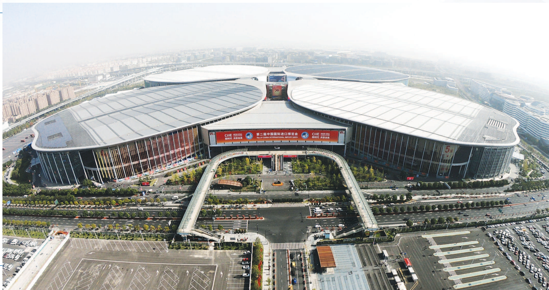
去年初尝进博会红利的参展商们纷纷争当“回头客”,今年将继续在“四叶草”亮绝活。图为第二届中国国际进口博览会主场馆俯瞰。

“进博会首发”提质扩容、线上线下对接渠道“火力全开”,“回头客”们不约而同地表示,中国市场已成为其全球战略最重要的组成部分,而他们也将拥抱前沿科技,携手更多合作伙伴,共享中国发展红利。