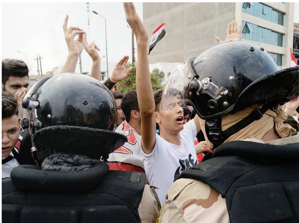
10月28日,在伊拉克首都巴格达,示威者参加抗议活动。

与2010年底中东非剧变自突尼斯爆发,进而导致诸多阿拉伯共和制国家的政治强人被迫离开权力舞台且国内乱不止相比,伊拉克恰恰因为提前完成了“民主化”改造而得以平稳过渡。换言之,阿拉伯世界整体的“乱”与伊拉克相