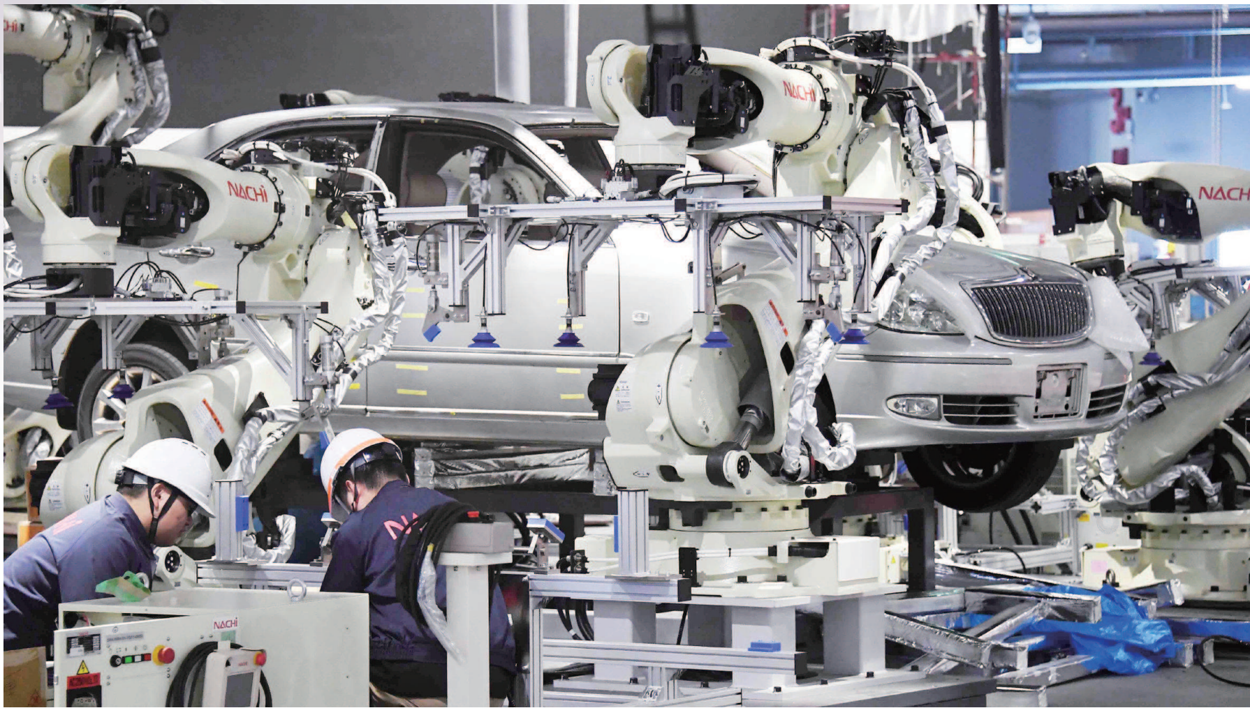
第二届进博会各参展商正按照计划，有条不紊抓紧布展。图为在机器人展区，参展商工程技术人员正在调试设备。