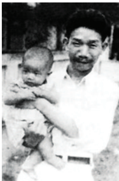
▲1944年，郁达夫怀抱儿子郁大亚在印度尼西亚苏门答腊留影

一九三七年七月二十四日，郭沫若在日本神户被捕，由日本警视厅秘密押解回国。在押解途中，郭沫若曾试图逃跑，但被日本警视厅发现并再次逮捕。郭沫若在日本期间，曾与日本警视厅的高级官员进行多次秘密接触，商讨了关于郭沫若回国的问题。日本警视厅最终决定，将郭沫若作为“文化人”而非“政治犯”处理，并为其回国提供了便利。这一事件引起了国内外的广泛关注和讨论。