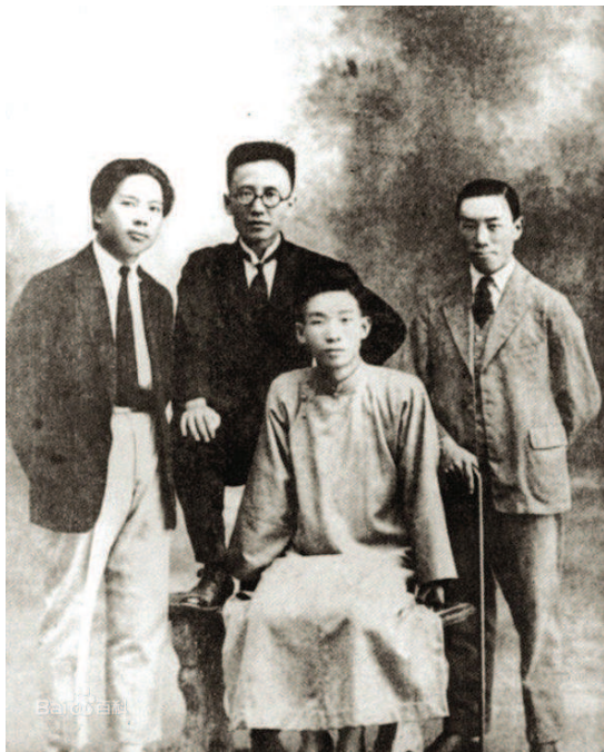
▲左起：王独清、郭沫若、郁达夫、成仿吾