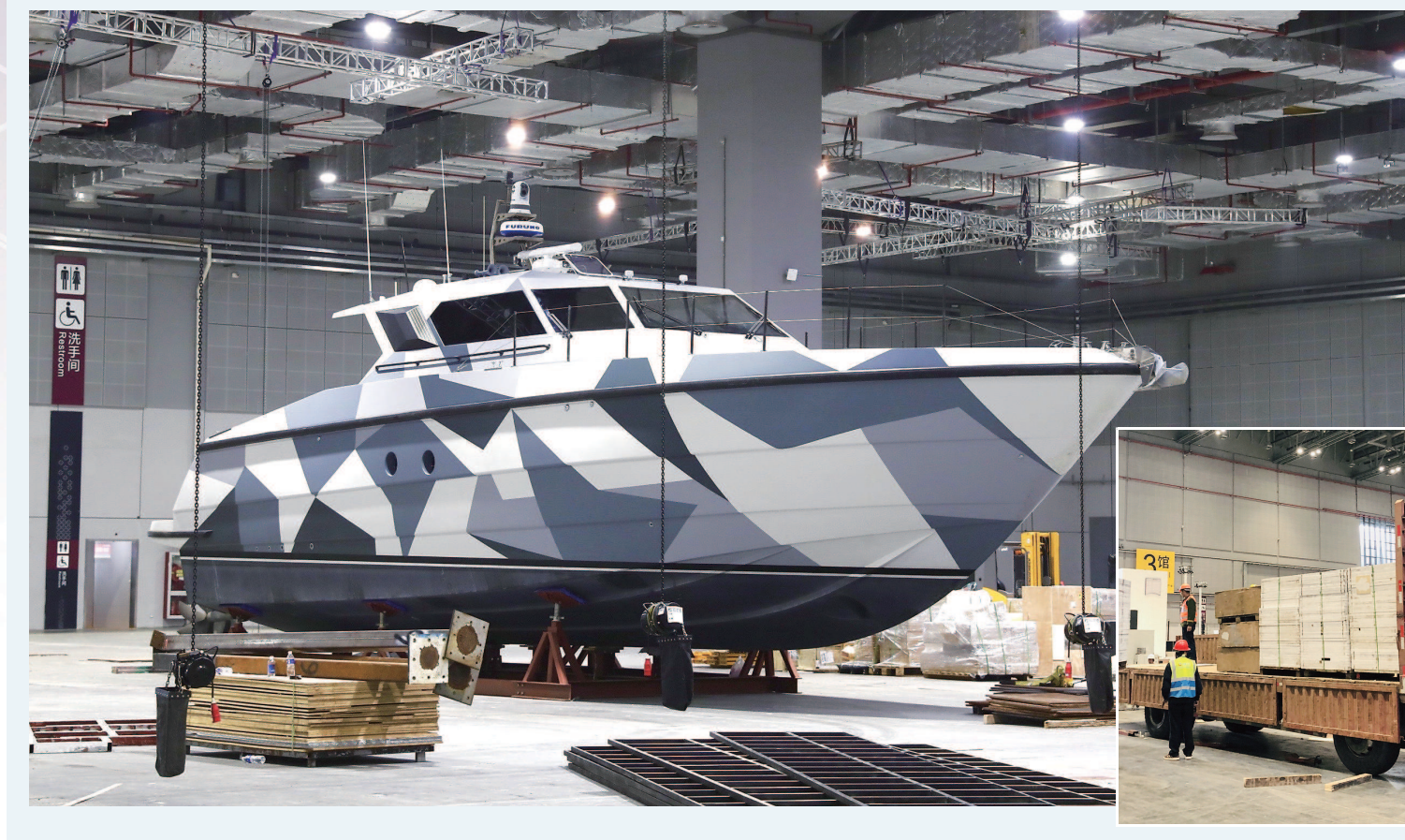
国家会展中心(上海)各展馆正在加紧布展。左图:来自意大利的法拉帝195型高速巡洋艇已揭开神秘面纱,在4.1号馆占据“C位”。右图:工人们在3号展馆里布展。