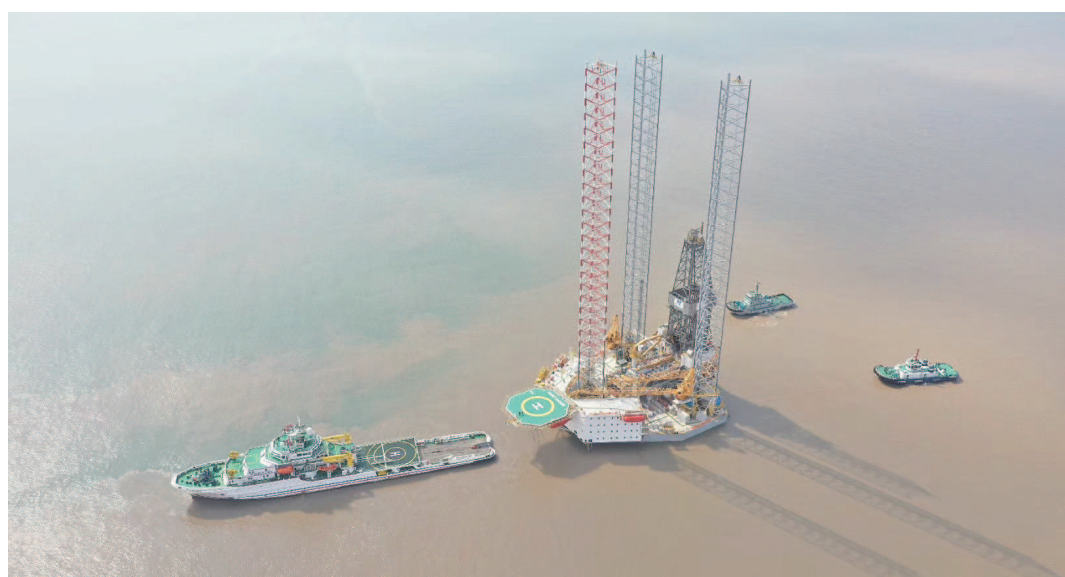
新片区“临港制造”魅力显现，沪产石油钻井平台首次临港全流程“一站式”出境交付。（边检供图）

为帮助打响临港“上海制造”品牌，增强沪上上海工企业的产品竞争力，洋山边检站为该类型特种船舶出境开辟特别通道，在绿华山锚地为海工平台和作业人员一次性办结平台换旗和半潜船及其随轮人员的出境手续。为28名船员办理了出境手续，为12名船员办理了离船入境手续，为企业节约成本近50万元，让海洋工程平台在“一带一路”建设中焕发新的生机和活力。