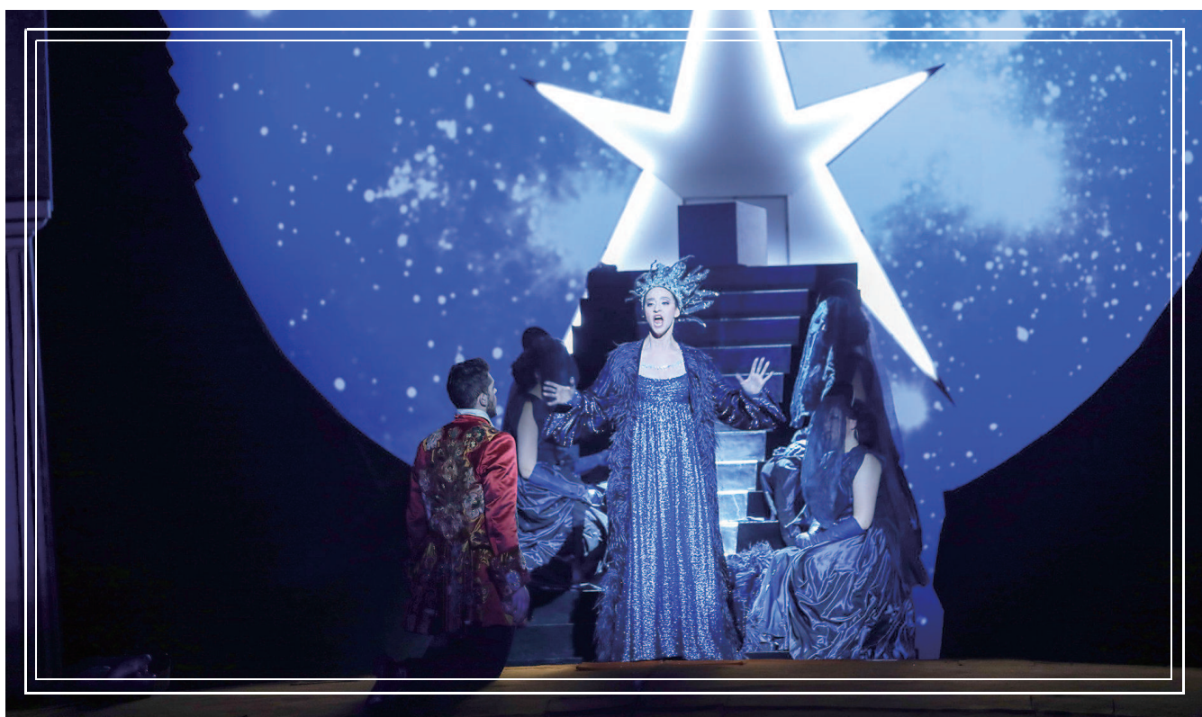
意大利斯卡拉歌剧院学院莫扎特歌剧《魔笛》排练照。

歌剧取材于诗人维兰德的童话集《金尼斯坦》中一篇名为“璐璐的魔笛”的童话，1780年后，由席卡内德改编成歌剧脚本。作品讲述了埃及王子塔米诺被巨蛇追赶，为夜女王的宫女所救，因夜女王女儿帕米娜的肖像画而对其一见倾心。夜女王赠塔米诺一支能解脱困境的魔笛，并告诉他帕米娜被恶人萨拉斯特罗夺走，希望他前去营救帕米娜，并允诺只要他成功归来，就将女儿嫁于他。事实上，萨拉斯特罗是智慧的主宰——“光明之国”的领袖。夜女王的丈夫死前把法力无边的太阳宝镜交给了他，又把女儿交给他来教导，因此夜女王十分不满，企图摧毁光明神殿。塔米诺经受住种种考验，识破了夜女王的阴谋，最终和帕米娜结为夫妻。作为一部多元化的歌剧，莫扎特在《魔