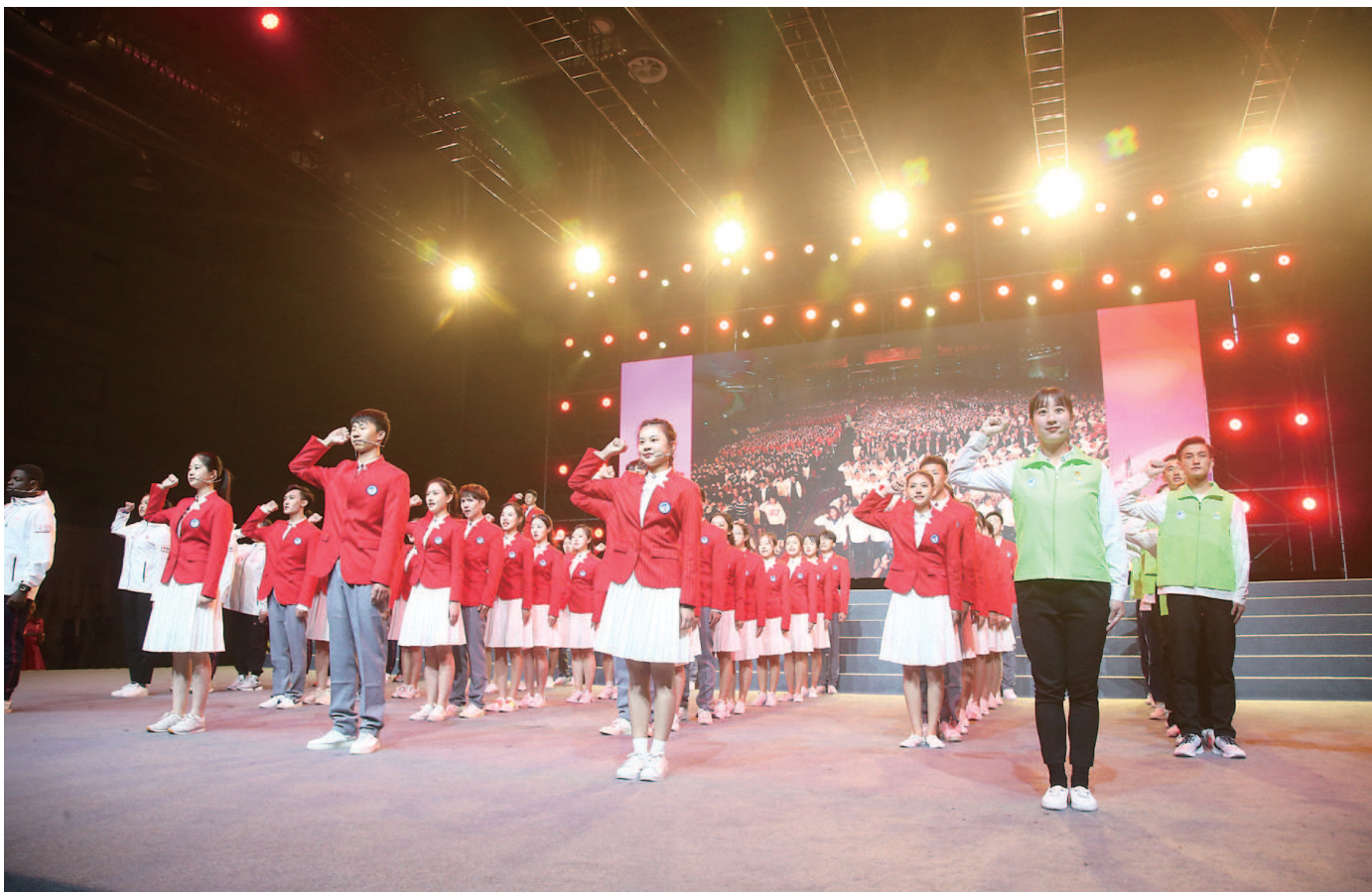
来自各大高校的志愿者们以最真诚、最响亮的青春之声庄严宣誓,表达了践行志愿精神、全心为进博奉献的信心与决心。

仪式上,首批志愿服务品牌站点和队伍获授牌。目前,全市已创建300多个城市文明志愿服务站,组建了200多支城市文明志愿服务队,约5万多名城市文明志愿者上岗服务。团市委在市级层面组建了434家青年文明号、156支青年突击队和50家青年安全生产示范岗。志愿服务主题歌《年轻的力量》群星版昨天同步上线。