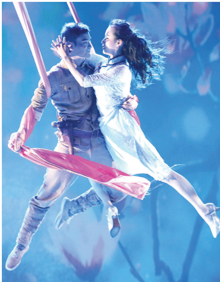
上海杂技团与上海市马戏学校打造的杂技剧《战上海》,首次用杂技语汇演绎上海解放的故事