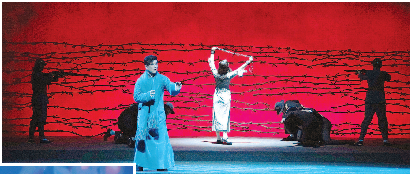
沪剧《一号机密》创新性地采用抒情手段展现党的地下工作

一批又一批的文艺工作者,时刻牢记为人民创作的宗旨,用艺术的真,筑起信仰的丰碑,自觉践行深入生活、扎根人民,力争创作出更多“有筋骨、有血肉、有温度”的作品。