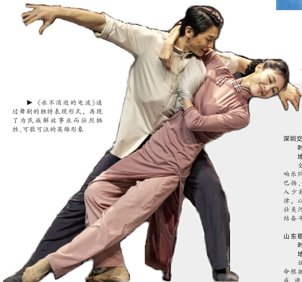
《永不消逝的电波》通过舞剧的独特表现形式,再现了为民族解放事业而壮烈牺牲、可歌可泣的英雄形象

沪剧《一号机密》更多展现的是平静中的暗流涌动,将地下党人真实的生活故事娓娓道来。剧本在尊重历史真实性的基础上,同时具有诗性的写意风格,它着眼于革命低潮时期“白色恐怖”中隐藏的那一小团红色火焰,探寻支撑那些火焰守护者的精神力量,追寻他们共同信仰所向的一颗初心。音乐融入了老上海元素,旋律上突出紧张感和压抑感,但在表达人物内心时,又不失沪剧曲调的抒情和细腻,唱腔在保留沪剧传统唱腔特色的基础上进行了一定的创新。