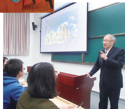
右图：全国教学名师刘西拉教授给交大同学上思政课。