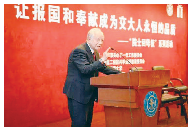
左图：“让报国和奉献成为交大人永恒的品质”——黄旭华院士在交大“院士回母校”系列活动上的讲话。

共襄新时代，携手创一流。上海交通大学通过“传承爱国心，织绘深蓝情，投身海洋行”系列活动，使师生在过程中得到了满满的获得感。2018年，中央电视台正片首发学校快闪作品《我和我的祖国》，交大师生用一场洋溢着青春和热情的快闪来表达爱国之情。2018年学校就业工作成效显著，学生赴重点行业、关键领域就业引导比例近七成（66.23%），博士生行业内引导就业率达86.96%。此外，极地与深海发展战略研究中心提交的观察员席位申请获得通过，我国在国际海底管理局的观察员席位获得“零”的突破，“中国话语权”在这一重要国际组织中正在加强。