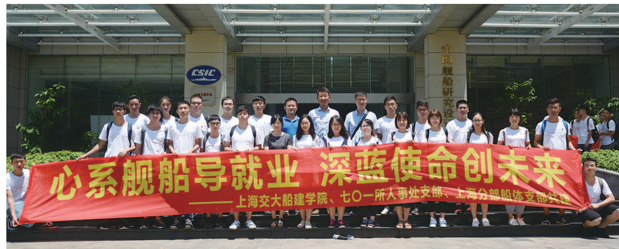
海洋共行党支部结对共建活动——打造交大红船足迹“共行计划”品牌项目。