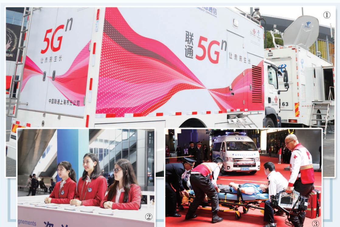
图①应急处置演练现场的通信车辆。图②志愿者们微笑迎接宾客。图③应急抢救伤员演练。制图:李洁