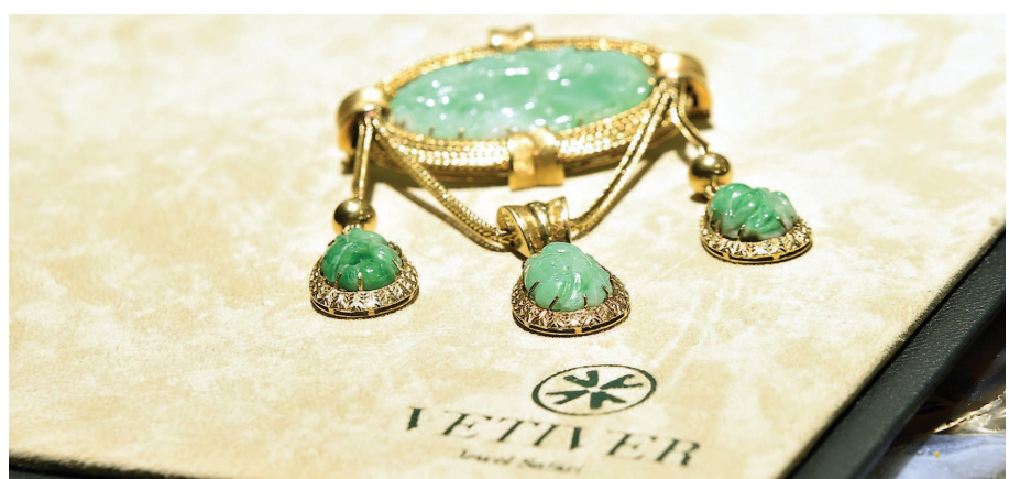
1920年的中国翡翠与意大利精工工艺“中西合璧”而成的珠宝精品。

10月8日凌晨,中远海运“银河”号轮载运着意大利进博会展品靠泊洋山港。这批到港的展品是意大利进口面包,重量达