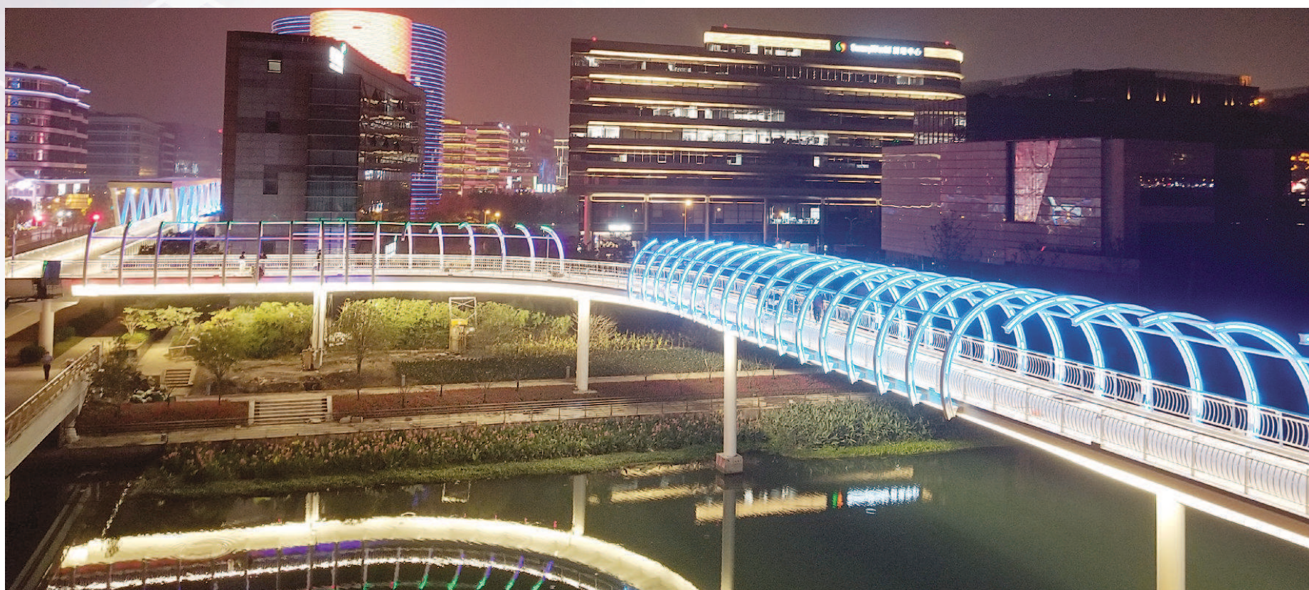
第二届进博会主场馆周边交通配套将更加优化。图为国家会展中心(上海)二层步廊东延伸段(二期)。