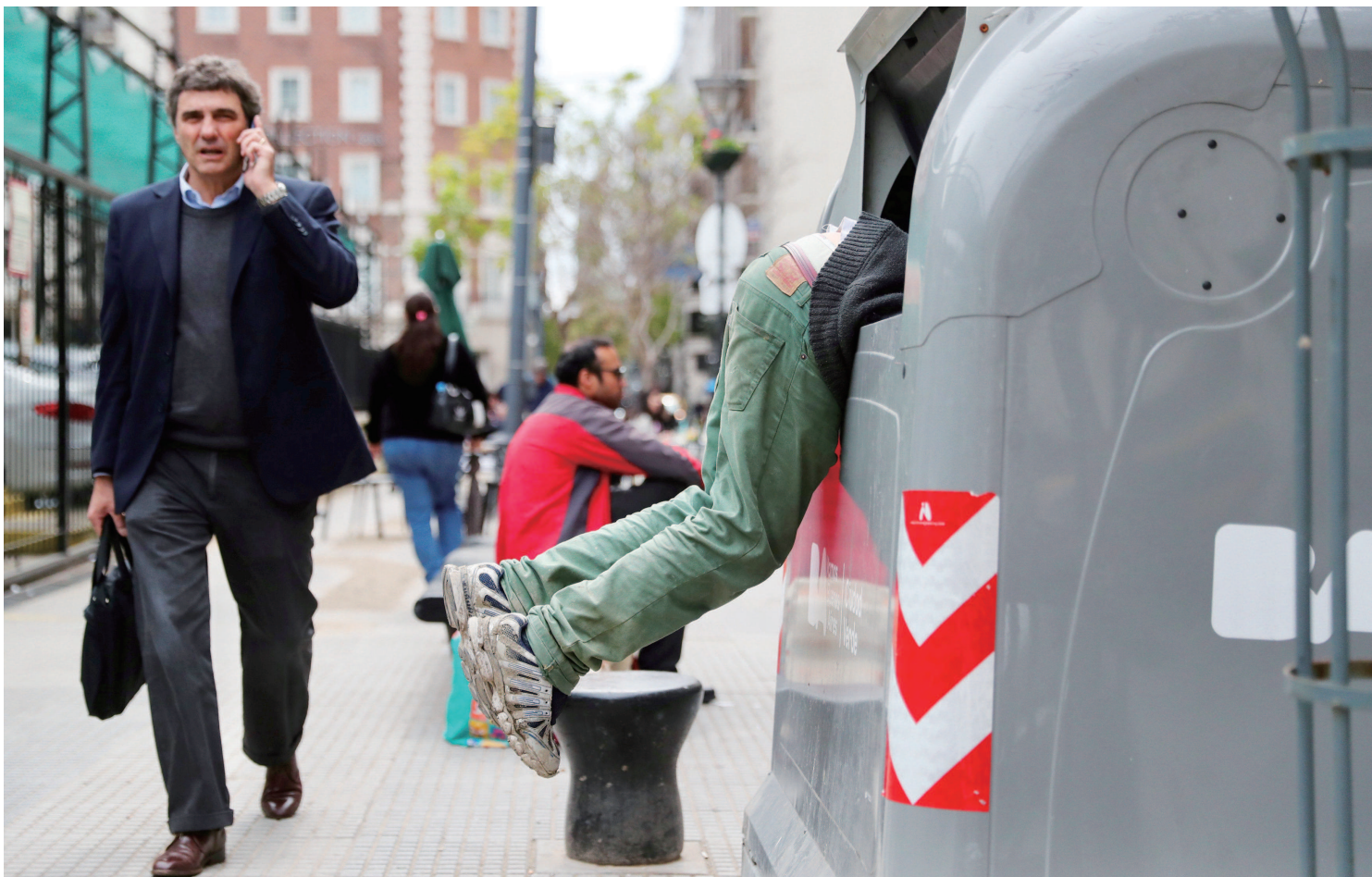
布宜诺斯艾利斯街头,一名男子在翻垃圾桶,阿根廷经济危机加剧了粮食紧张状态。

一名神秘的修女进入威斯巴登的BKA大楼,并宣称在接下来的7天内将发生7起谋杀案。