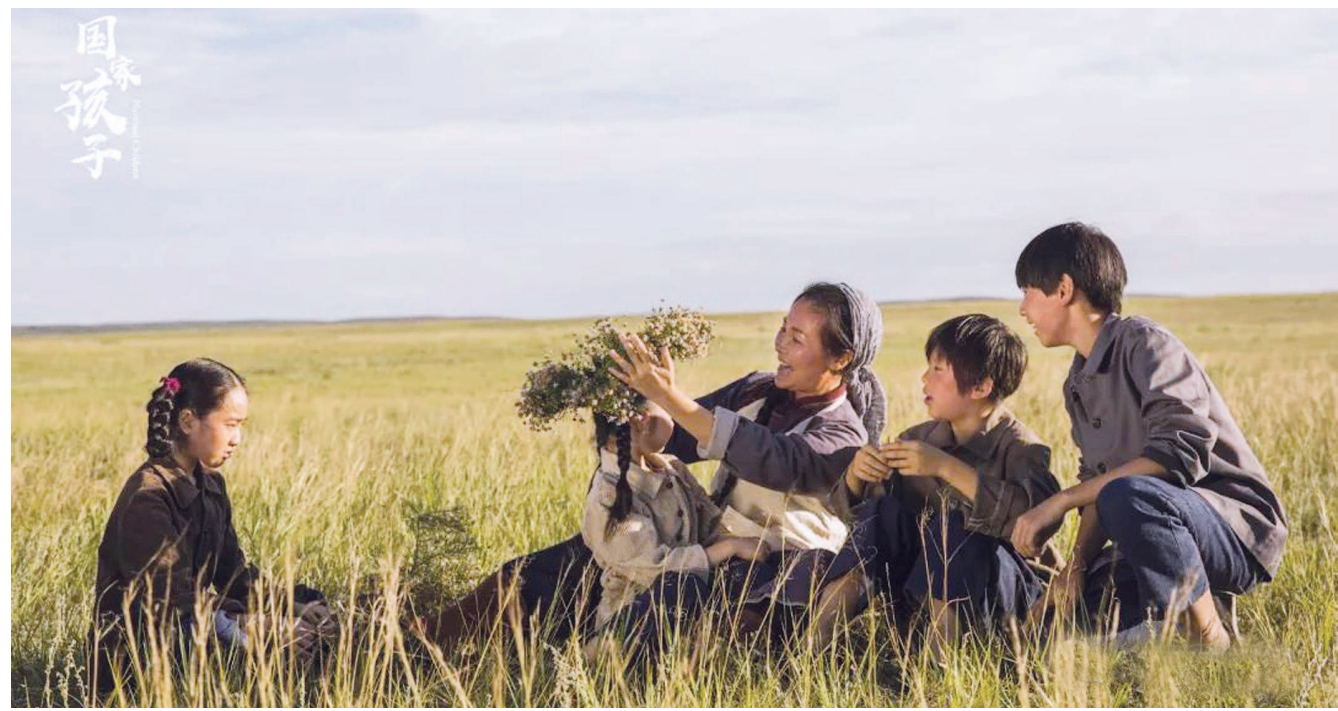
《国家孩子》中的主人公之一乌兰的角色原型正是前不久获得“人民楷模”国家荣誉称号的“草原额吉”都贵玛老人。

上世纪60年代初，一场自然灾害席卷大半个中国，上海、江苏、浙江、安徽等江南地区出现大批弃婴。眼看着育婴堂的米粮即将见底，周恩来总理和内蒙古自治区乌兰夫主席达成共识，将部分江南地区的弃婴、孤儿带到草原，由内蒙古牧民抚养。善良的草原牧民积极伸出了援手，并且许下“接一个，活一个，壮一个”的感人承诺。这批被善良的草原额吉、阿爸悉心抚养长大的汉族孩子便被称作国家孩子。真诚的情感与无私的奉献，总能打动一代人。近期，“三千孤儿去草原”的大爱传奇又一次被搬上荧屏。正在央视八套黄金档播出的电视剧《国家孩子》，自开播以来，收视率一直位居前列。“震撼的电视剧，更震撼于那段确有其事的真实历史。”有网友如此评论。不少起初陪伴父辈观剧的青年观众，由此了解到了这段历史，并为剧中人湿了眼眶。