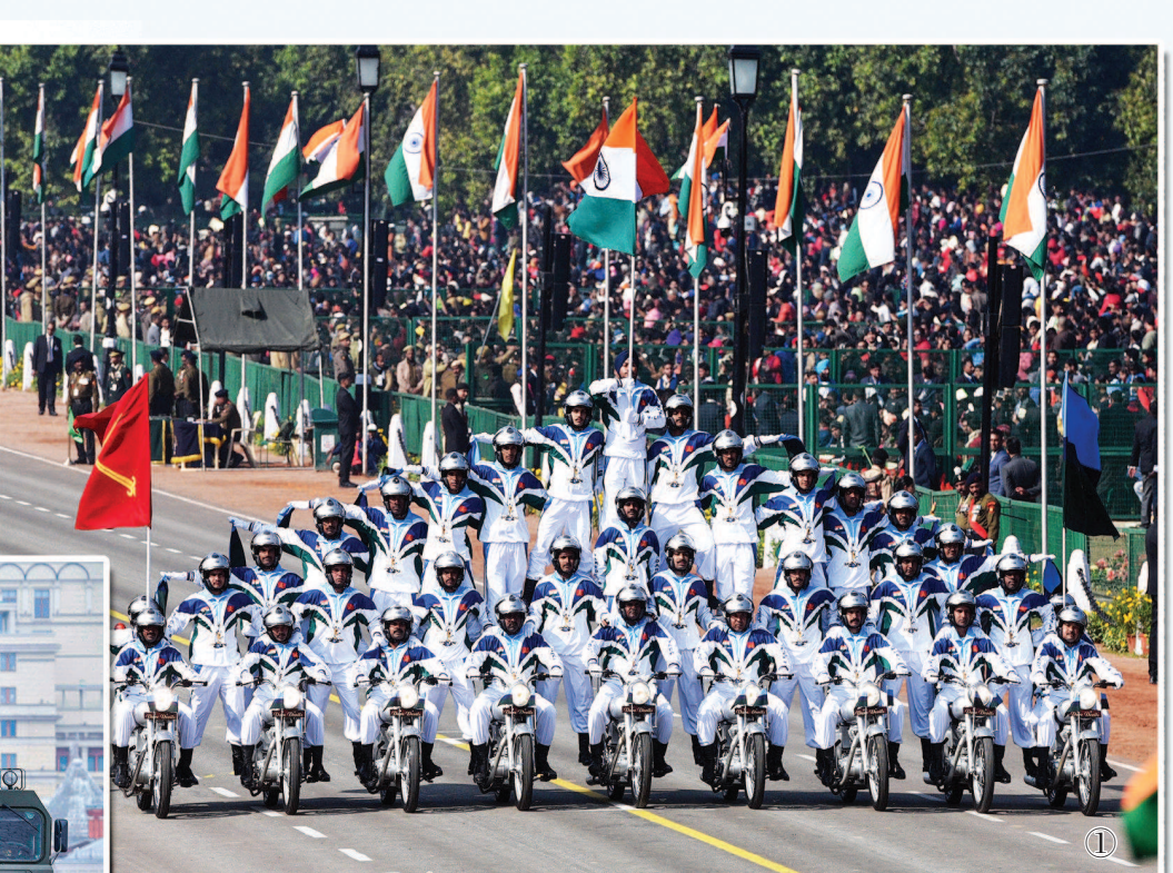
① 1月26日,共和国日阅兵上的摩托车特技表演已成为印度特色。 ② 7月14日,法国国庆阅兵式上,酷似“钢铁侠”的飞天表演最具轰动效应。 ③ 5月9日,俄罗斯在胜利日阅兵式上展示RS-24洲际弹道导弹。