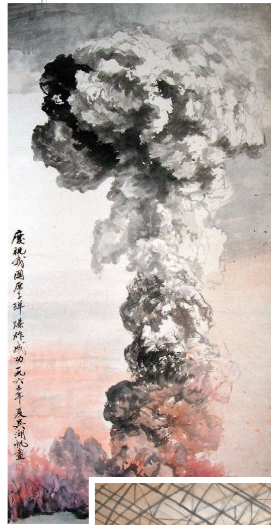
吴湖帆 《庆祝我国原子弹爆炸成功》 中国画 1965年

1964年,我国试爆第一颗原子弹成功。吴湖帆心情无比激动,感慨祖国的日益强盛,想用画笔把这一历史时刻描绘出来。他以传统的卷云皴和没骨烘染法描绘了原子弹爆炸时不断翻涌、徐徐上升的烟云巨柱的场景。