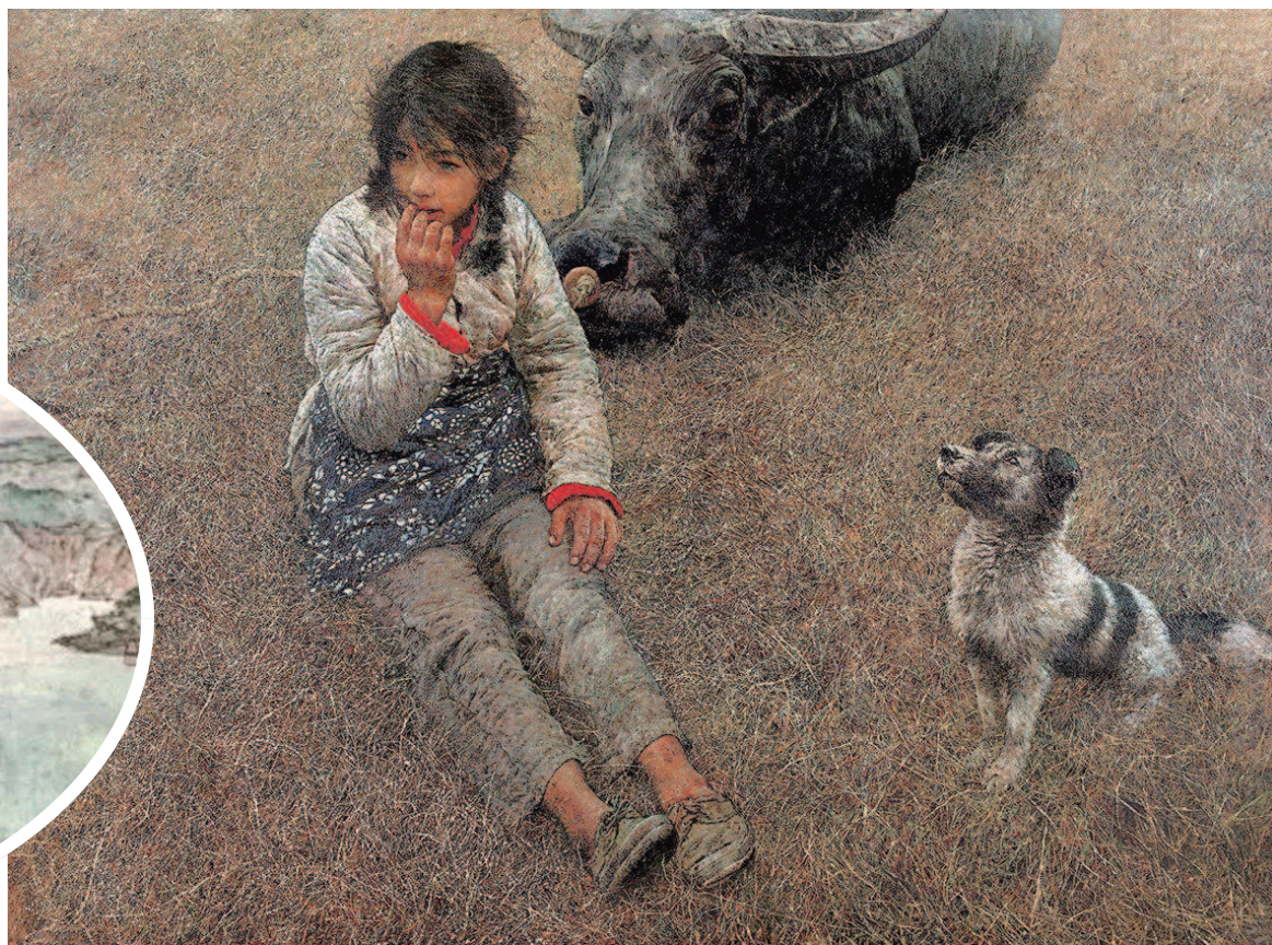
何多苓 《春风已经苏醒》 油画 1981年

这幅作品是新时期的代表作之一。画面上,春风沐浴下的少女似乎有所思悟,卧地的水牛和仰视的狗是她的伙伴。这极其平凡的农村场景,在作者的笔下表达得充满诗意。作品以一种清新的意象和抒情意味开启了中国乡土写实主义绘画的另一个途径——对人和人的生命、情感以及人性的理解、认识、描绘,打动了无数观众的心灵,从一个新的视角和美学意味开辟了中国油画的一个新领域。