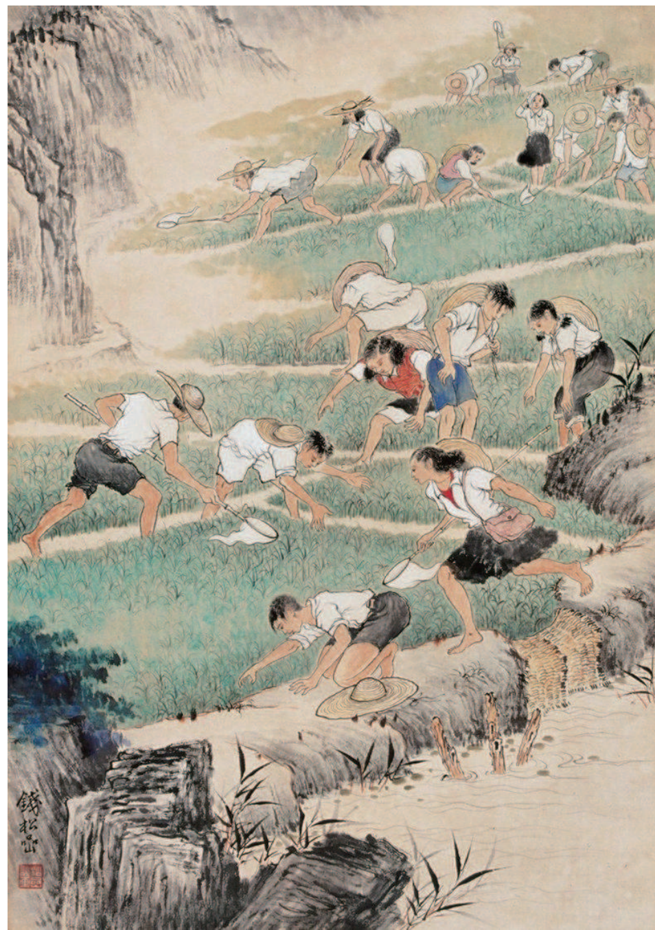
钱松喦《治螟图》 中国画 1950年

新中国美术创作的初步成就表现在1955年的第二届全国美术作品展览上，当关山月的《新开发的公路》、李斛的《工地探望》、石鲁的《古长城内外》、张雪父的《化水灾为水利》、岑学恭的《木筏》等作品出现时，这批与建设主题相关的作品表明了艺术家们在改造旧国画过程中所出现的由写生到表现新生活的变化，标志了上世纪50年代初期以来具体的创作成果。其中传统的国画再也不是文人雅士脱离尘世的孤芳自赏，这种表现时代风貌的作品也为“新国画”在新社会获得了重要的地位。这一时期国家建设项目中