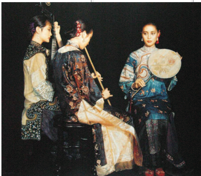
陈逸飞 《浔阳遗韵》 油画 1991年

这幅作品以饱满的构图、明朗的色调定格男女老少欢聚一堂的其乐融融。人物的造型体现了艺术家扎实的素描功底，而背景的表现则尽显艺术家传统国画的笔墨修养。