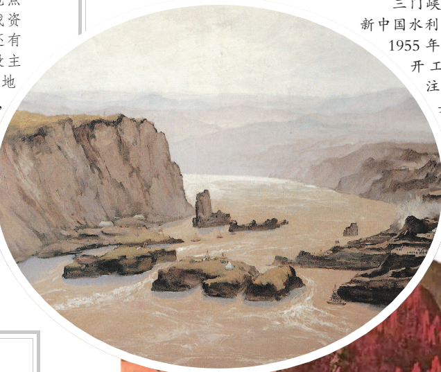
吴作人《黄河三门峡·中流砥柱》（局部） 油画 1955-1956年

三门峡水利枢纽工程是新中国水利史上第一大工程。1955年，吴作人在工程开工之前就开始关注这一建设场景，并计划随之创作《黄河三部曲》，这是其中的第一幅。