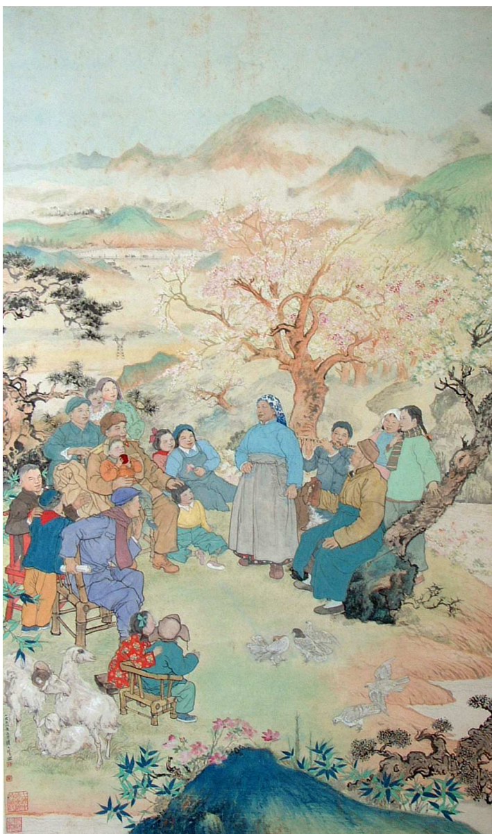
程十发 《歌唱祖国的春天》 中国画 1957年

三门峡水利枢纽工程是新中国水利史上第一大工程。1955年，吴作人在工程开工之前就开始关注这一建设场景，并计划随之创作《黄河三部曲》，这是其中的第一幅。