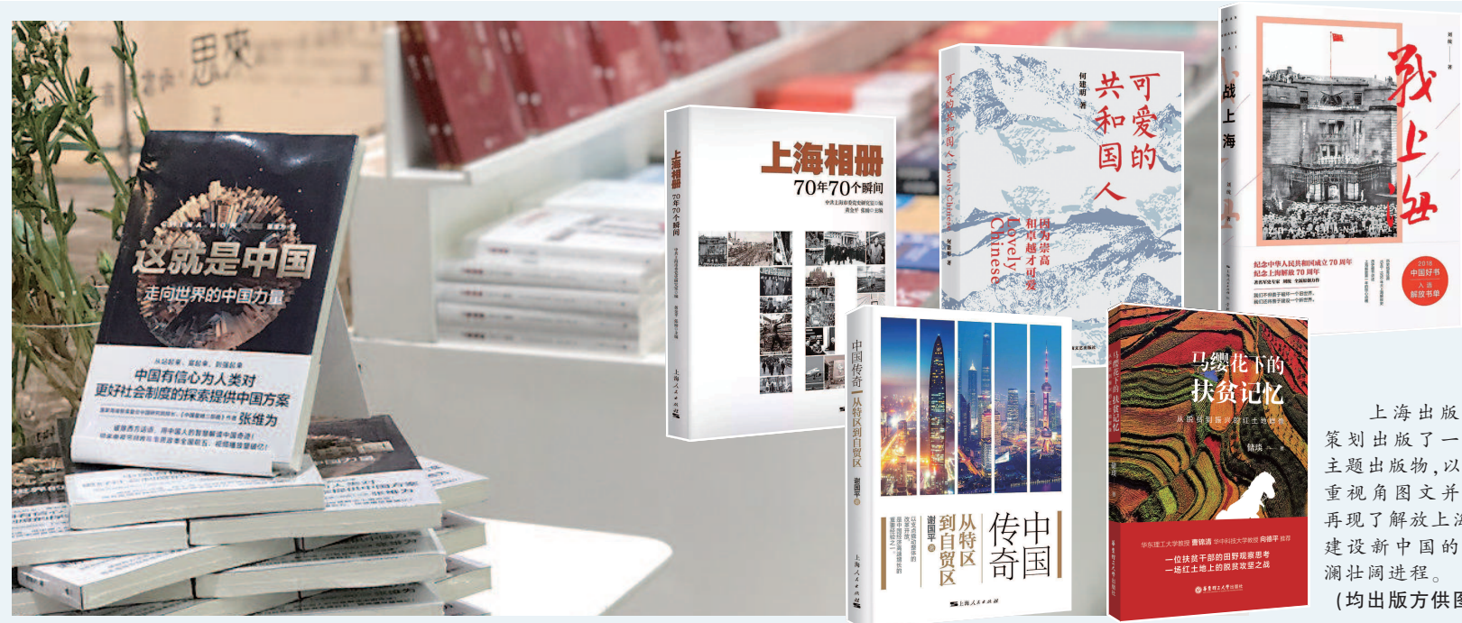
上海出版界策划出版了一批主题出版物,以多重视角图文并茂再现了解放上海、建设新中国的波澜壮阔进程。

记录书写70年来的“高光时刻”和奋斗者群像,是国家之需、民族之需、时代之需,也是上海出版人的使命与追求。在上海人民出版社社长、总编辑王