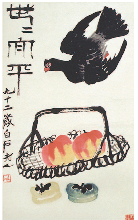
齐白石创作了许多以柿子、寿桃为题材的作品,这幅《世世太平》是齐白石1952年创作的画作,以“柿柿(世世)”“和平”引申出“世世太平”的吉祥寓意。

事实上,在花鸟画出名之前,齐白石的人物画早已声名远播。他擅长画仕女,还因其在湘潭当地赢得了“齐美人”的称号。衰年变法后,齐白石人物画的面貌发生了巨大的转变,从早期的工细写实转向简率粗放,常以寥寥数笔表现人物神情的微妙变化。比如本次展出的《宰相归田》,简单数笔便将毕卓的形象描绘出来。据《晋书》记载,毕卓虽身居吏部郎,身处乱世中但坚守本分,为官清廉,不贪权势,宁肯因家贫盗酒,也不贪赃枉法与他人同流合污。齐白石的人物画继承了古法,不见人体素描结构,用色也很简单,质朴简练。“齐白石的绘画思想中有一条是非常重要的,就是‘妙在似与不似之间’。无论是画花鸟,还是画人,他都一直秉承着这个美学思想,一以贯之。”陈琪说。