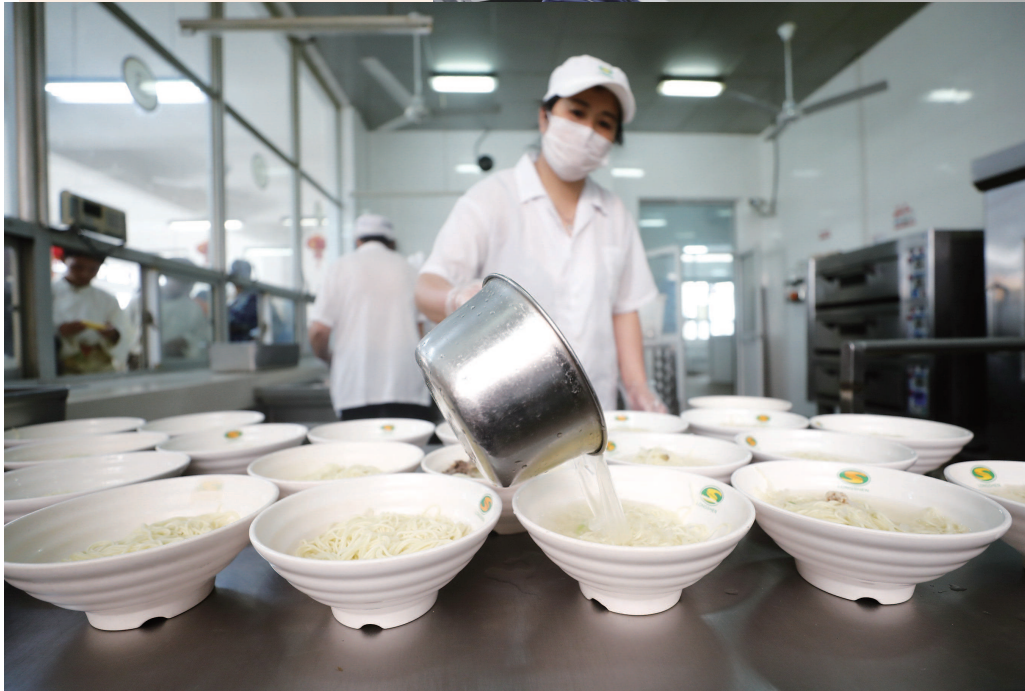
▲苏河湾项目工地建筑工人和管理人员同吃“国庆面”。 ▲晋元高级中学的食堂为学生特地准备了“国庆面”,共庆佳节。