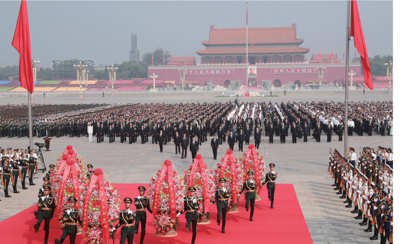
习近平、李克强、栗战书、汪洋、王沪宁、赵乐际、韩正、王岐山等党和国家领导人出席烈士纪念日向人民英雄敬献花篮仪式。

新华社北京9月30日电（记者杨维汉罗沙）在庆祝中华人民共和国成立70周年之际，烈士纪念日向人民英雄敬献花篮仪式30日上午在北京天安门广场隆重举行。习近平、李克强、栗战书、汪洋、王沪宁、赵乐际、韩正、王岐山等党和国家领导人，同各界代表一起出席仪式。