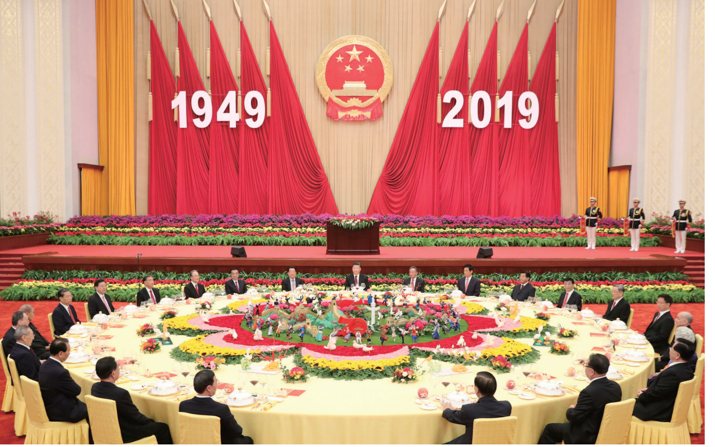
习近平、李克强、栗战书、汪洋、王沪宁、赵乐际、韩正、王岐山等党和国家领导人与4000余名中外人士欢聚一堂，共庆新中国70华诞。