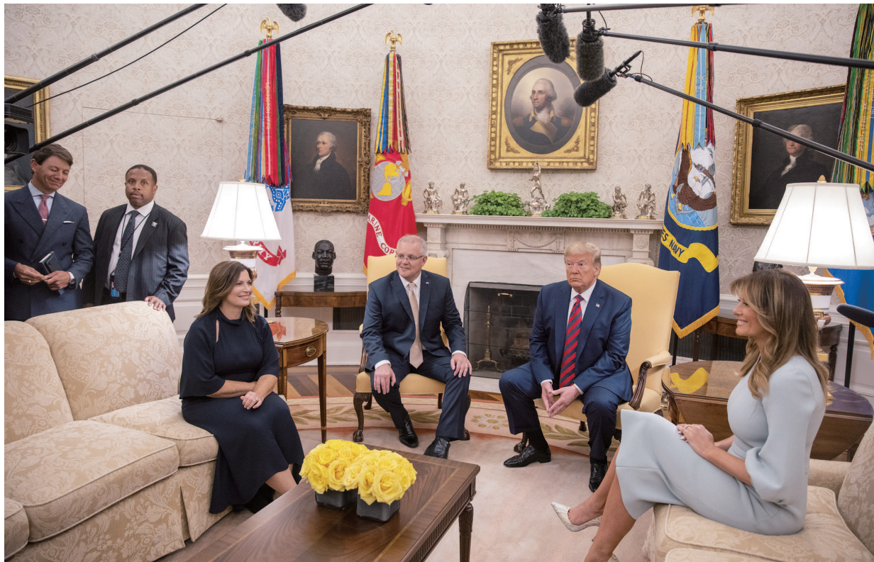
20日，特朗普在白宫会见到访的澳大利亚总理莫里森，并举行联合新闻发布会。

此次通过高调接待莫里森来访，特朗普首先可以彰显自己对盟国关系的重视，昭示吾道不孤、友邦来朝。其次则