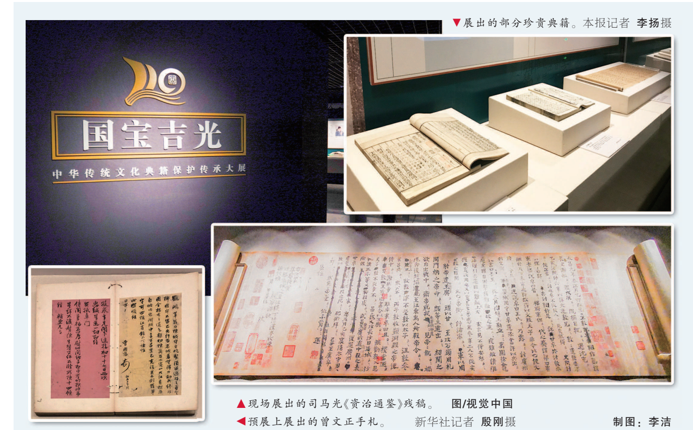
展出的部分珍贵典籍。

同时,展览首次全面展示新中国成立以来中华传统文化典籍保护传承事业的发展历程和成就,特别是“中华古籍保护计