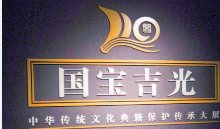
中华传统文化典籍保护传承大展