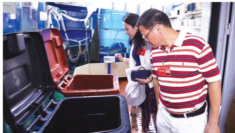
题图:中国人民政治协商会议上 海市第十三届委员会第二次会议 开幕式 上图:2018年4月10日,市政 协委员赴市隐楼、宜稼堂、徐光 启故居等地开展“传承文脉,保 护城市历史风貌”专题调研。 下图:2019年8月20日市政 协委员视察《垃圾分类条例》 执行落实情况。

善于调查研究也是人民政协工 作的基本功。2018年,在上海 深入开展“不忘初心、牢记使命” 主题教育背景下,市政协全面 动员、全员发动,高质量完成 市委主要领导交办的6项重大调