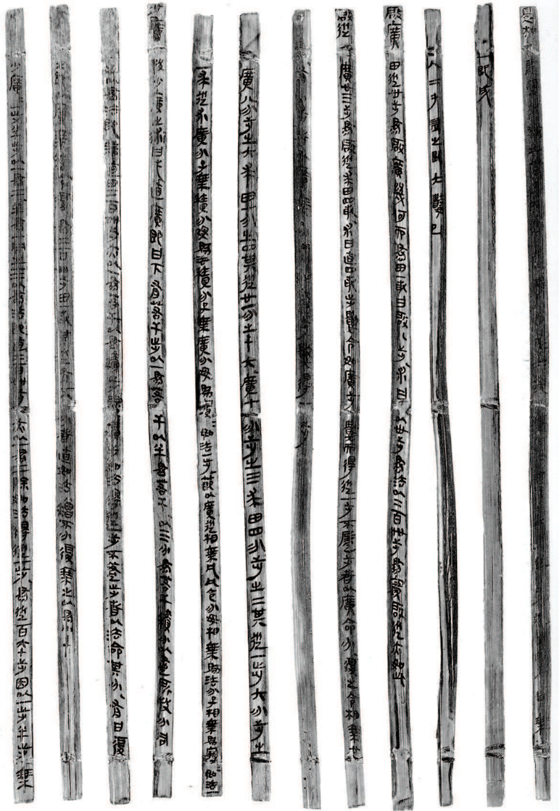
▲ 张家山出土《算数书》之《少广》，右数第9行起，据《张家山汉墓竹简（二四七号墓）》，文物出版社，2001年

计算，但未揭出这两句也直接表明“投”的词义等同于“直”。他将“直”读为“值”，解为“数值”，则可商榷。此“直”应和《算数书》中的“直”一样，释为“置”，即用算筹摆出数字，给出计算条件。上引文“置”用在“日辰时”前面，所置确是它们的数值，但“置”本身并不是数值。