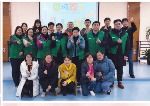
嘉兴路街道垃圾分类青年志愿者团队