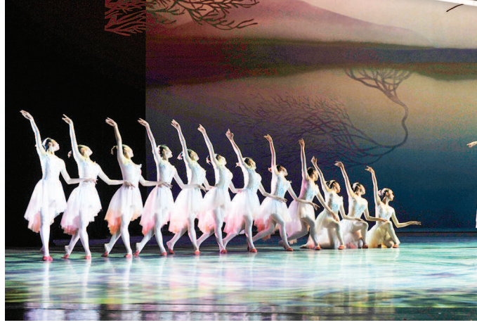
①刘海粟美术馆外观。②上海凝聚力工程博物馆。③上海国际舞蹈中心。④舞剧《朱鹮》。

定少不了市民点单和社会各界的智慧与创新。深谙此理的长宁区始终认为，公共文化服务的供给侧必须充分调动社会各界的积极性，发挥各方优势，通力合作，强强联手，使自上而下的行政主导变为自下而上的多方合力，实现由政府、企业、非营利组织和广大市民共同参与和提供公共文化产品和服务。