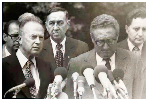
▲一九七五年七月，以色列总理拉宾（左）与美国国务卿基辛格在记者会上

是真的拒绝让出西奈沙漠吉迪和米特拉两个山口的通道？他是不是仍然坚持要用“永久结束交战状态”模式换取进一步撤军？如果拉宾拒绝让步，基辛格是不是真的威胁要回华盛顿，责怪以色列毁了他的使命？