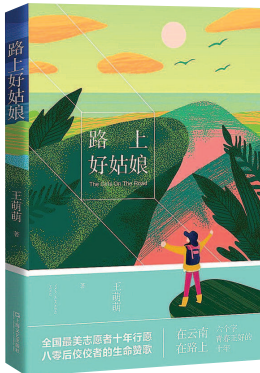
《路上好姑娘》 王萌萌著 上海文艺出版社出版(二〇一九年七月版)

王萌萌笔下记录的那些让她心疼的姑娘们,是她踏上行程的起点,也是她深信此行值得的依仗,是她能一直走下去的动力。最为可贵的是,她不认为这是她单方面的悲悯与付出,她希望她的记录“能些微呈现出她们给予我的丰盈与成长”。这就涉及到一个重大的自我成长的课题了。中国