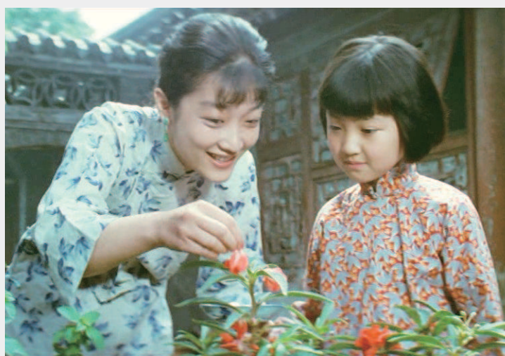
《城南旧事》上映于1983年，是吴贻弓首次独立执导的电影，他因此片获得第三届中国电影金鸡奖最佳导演。