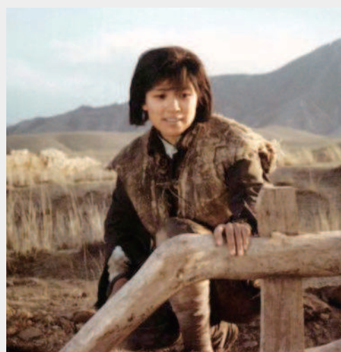
影片《姐姐》中，宋春丽扮演女红军战士。