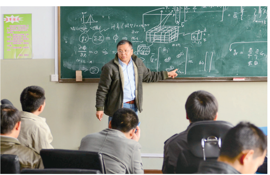
黄大年在为吉林大学的學生授課(2011年4月10日攝)。

2015年9月9日，习近平总书记给“国培计划(2014)”北京师范大学贵州研修班参训教师回信，勉励他们“牢记使命、不忘初心、扎根西部、服务学生，努力做教育改革的奋进者、教育扶贫的先行者、学生成长的引导者”。 2018年教师节，习近平总书记在全国教育大会上强调，“全党全社会要弘扬尊师重教的社会风尚，努力提高教师政治地位、社会地位、职业地位，让广大教师享有应有的社会声望”。 一个迈向伟大复兴的民族，需要什么的教育？一项开辟新篇章的事业，召唤什么样的人？党的十八大以来，带着对这些重大问题的深邃思考，习近平总书记对教师群体的角色定位不断提出新的更高要求，为教师队伍建设指明方向—— 总书记以“无上光荣”这四个字形容