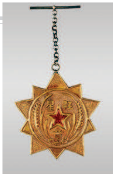
▲中华苏维埃共和国中央革命军事委员会颁发的红星奖章

我们部队到了牛屎房以后，就看到了写的捷报上说：“此地就是牛屎房，距包座尚有四十里，前面部队已在阿巴打了胜仗，消灭敌人两个旅旅获甚多，除了武器弹药之外，尚有大批白面、大米、糌巴。”这一来就给了我们部队精神上会了餐，好似肚子饥饿也好些，精神上更愉快了。正在这时候团部下达了命令，部队今天还得继续前进四十里，到包座宿营。部队就此休息卅分钟，进行了简短的解释工作，在解释工作中，只是说明此地无粮食，必须再进四十里，到那里后部队可休息两天。就这样部队就继续前进了，走了一点多钟的黑路，晚八时多就到达了包座。肚子确实是饿得扁扁的、空空的了，幸好各单位的打前站人员及管理人员先到了营地，并得到前面部队的帮助，他们号好了房子，准备好了粮食。只消一个钟头的时间，部队已完全进入入舍，有的已得到了饭吃。这时我已由一营回到政治处。有的同志说：“一碗炒青稞，走了一百一。到了宿营地，白面和大米，比青稞多么好吃啊！”有的说：“还有一碗炒青稞，换来了胜利。消灭敌人两个旅，饭吃他一顿——白面和大米。”我团就这样结束了六天的草地行军。