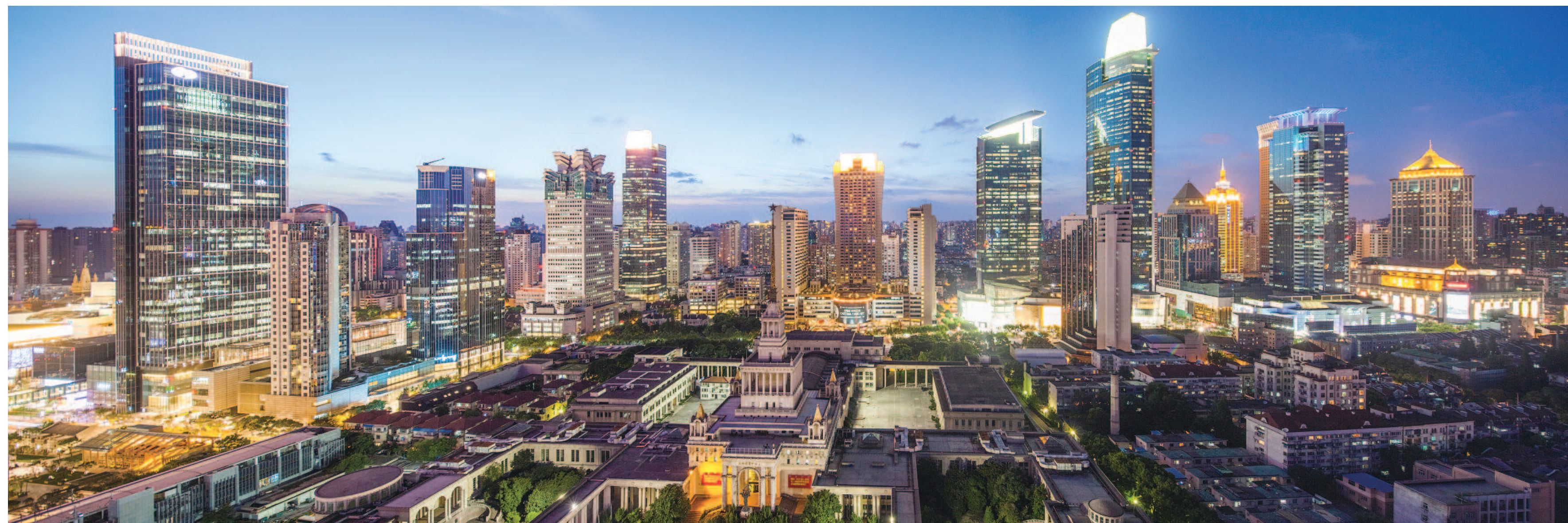
作为全市跨国公司地区总部落户数量最多的城区之一，截至今年8月，静安区已累计引进跨国公司地区总部81家。图为静安区中心商务区。